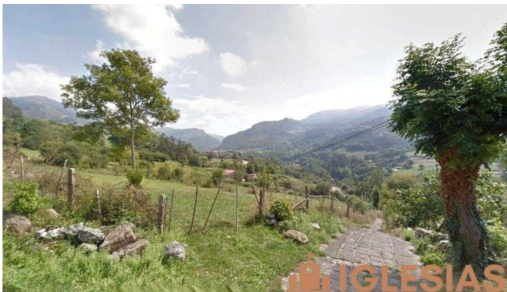
Ermita del carmen cantabria