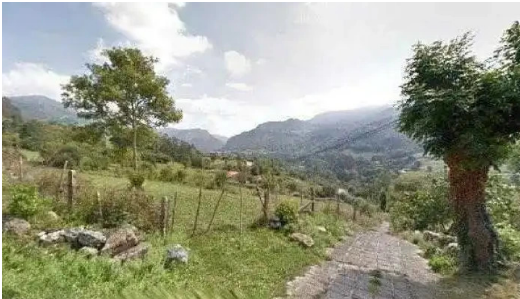
Ermita del carmen iglesia