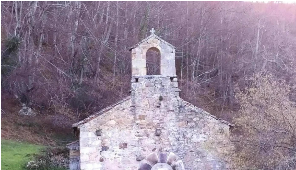
Ermita de san pedro de toja iglesia