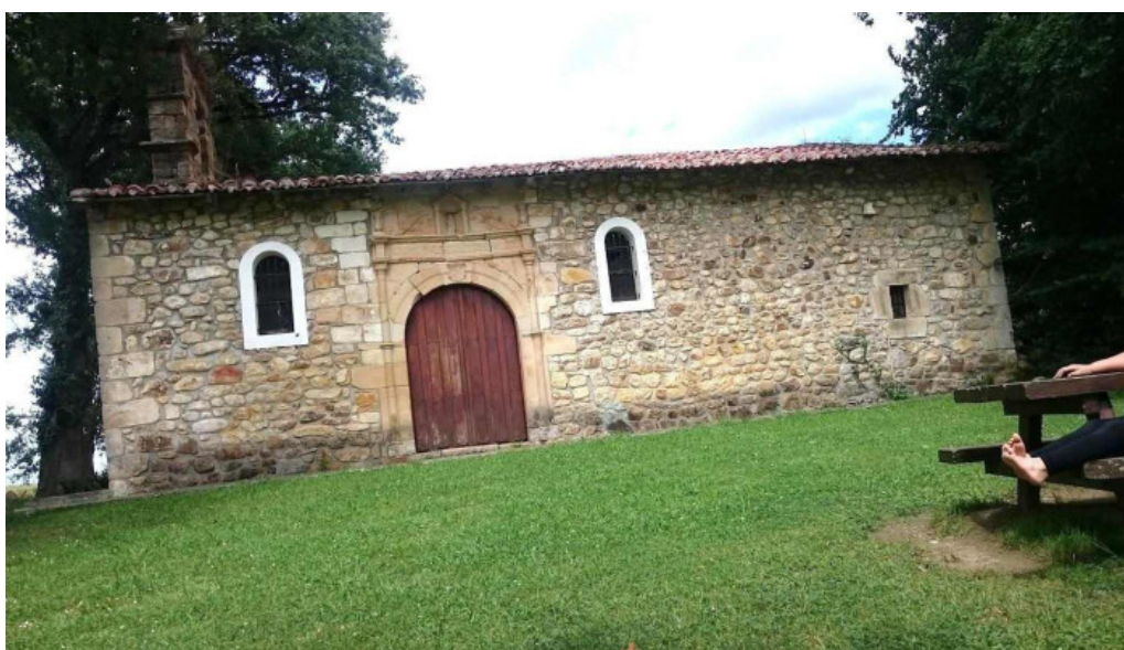
Ermita de san blas cantabria