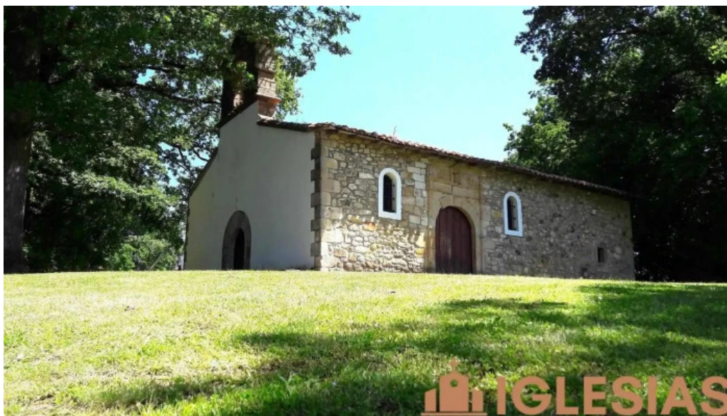
Ermita de san blas iglesia