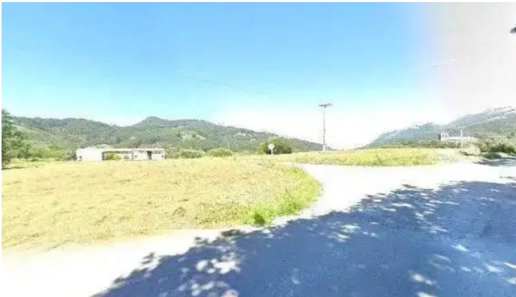
Ermita de san blas sitio web