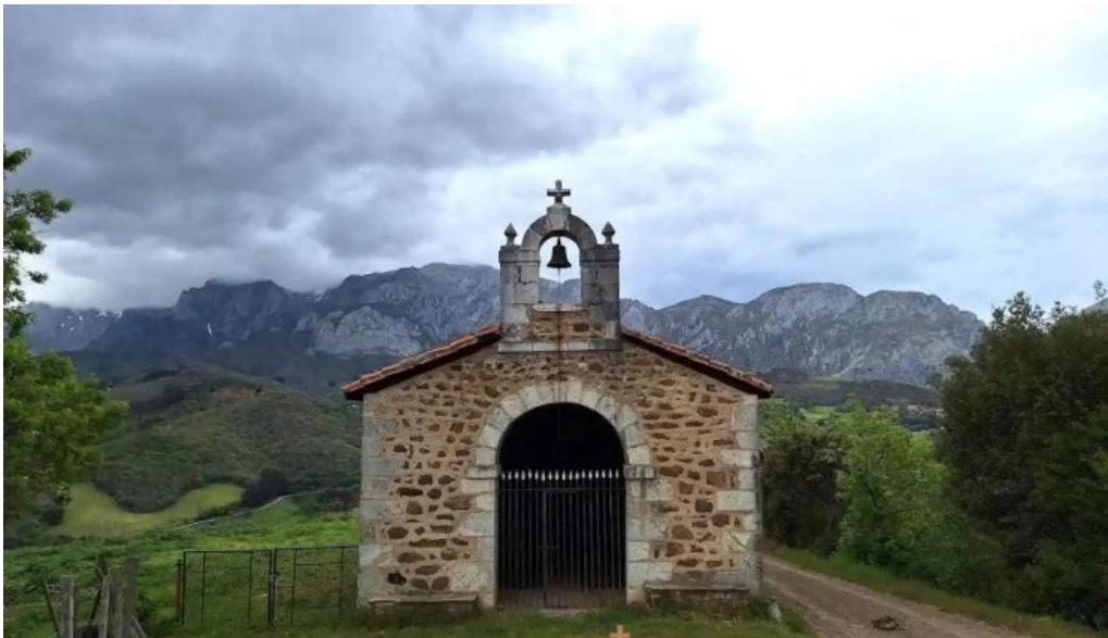
Ermita de guadalupe cantabria