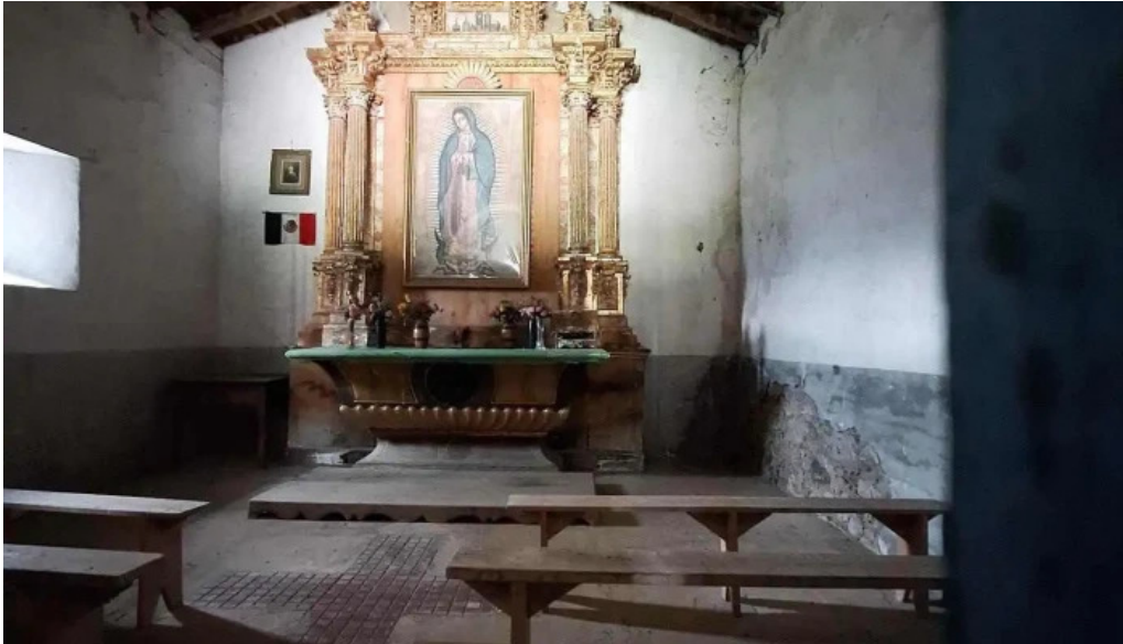
Ermita de guadalupe iglesia