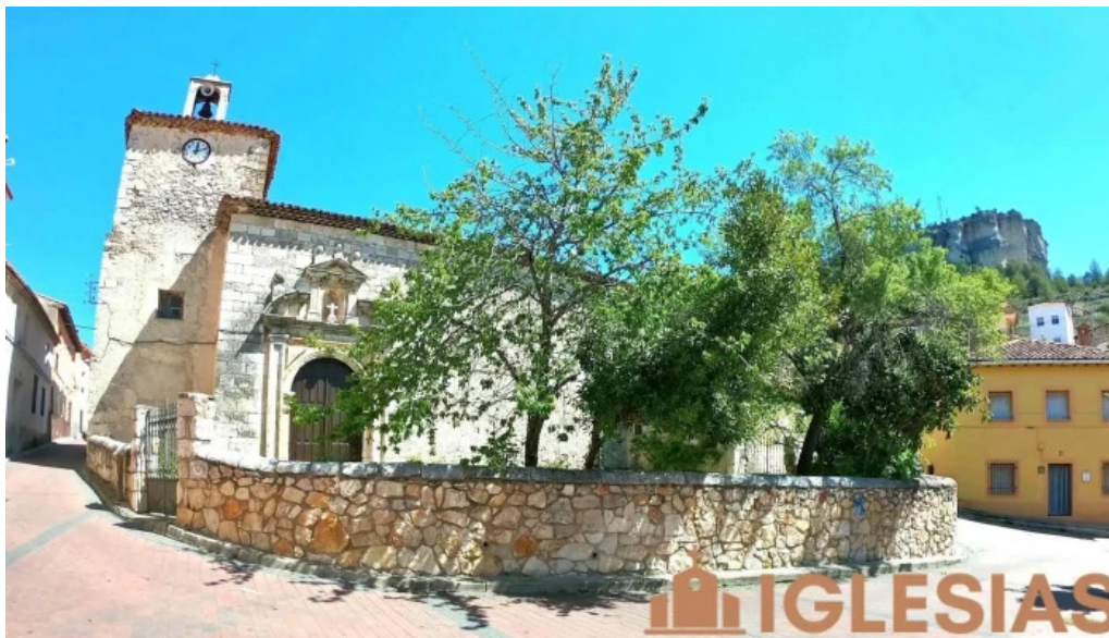
Iglesia de santiago apostol iglesia