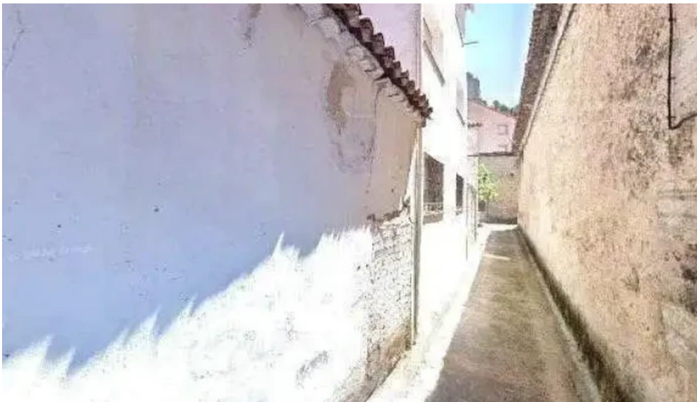
Iglesia de santiago apostol sitio web