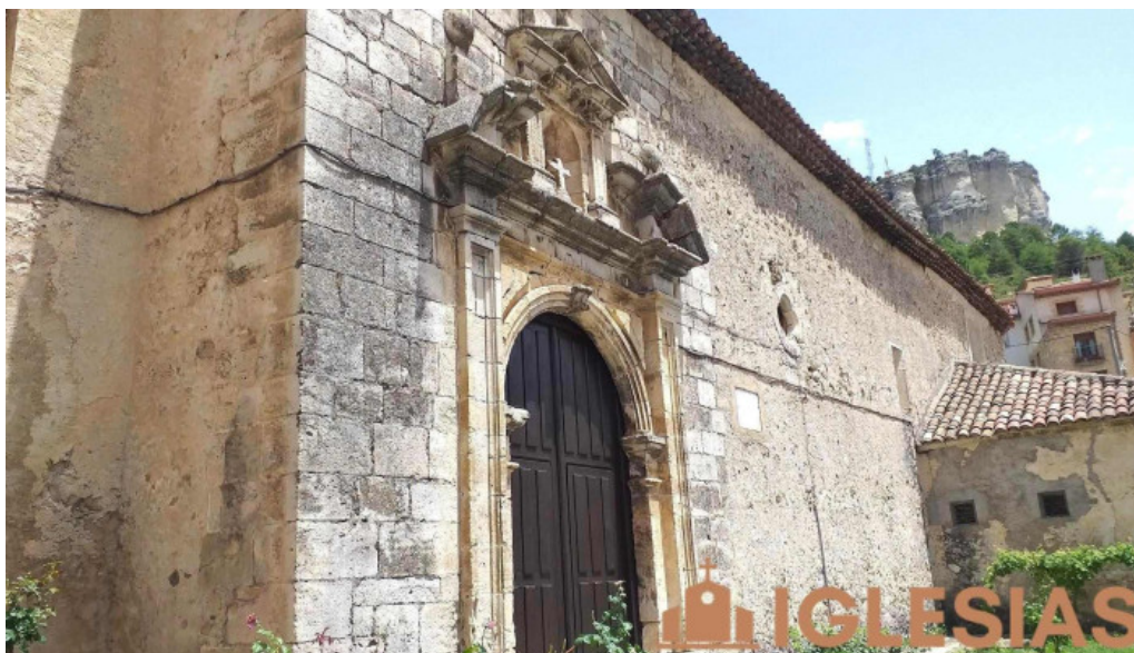
Iglesia de Santiago Apóstol Canizares