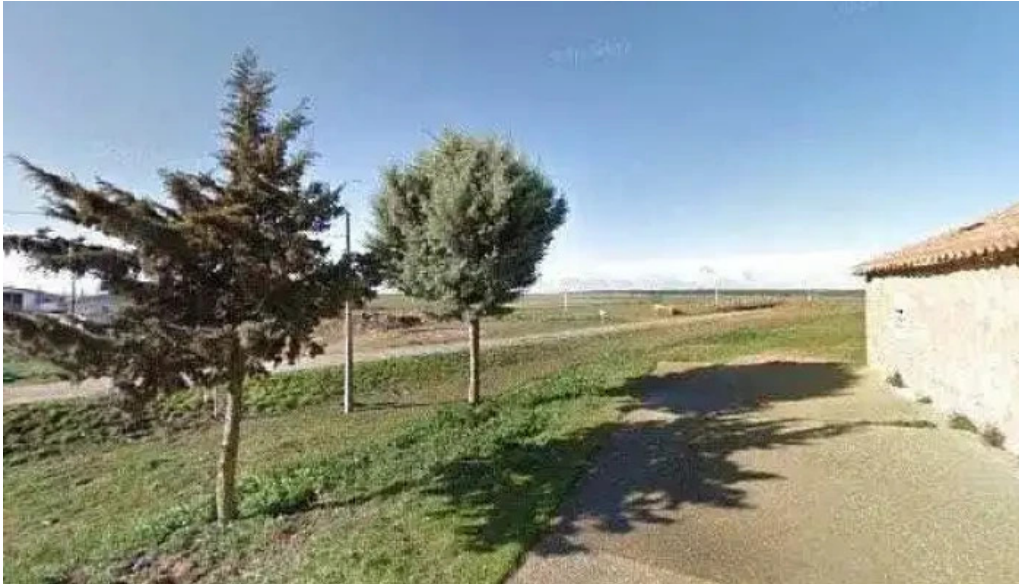
Iglesia parroquial de san vicente martir iglesia