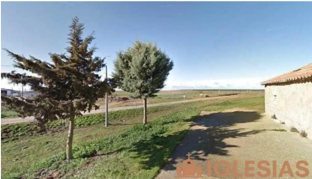
Iglesia parroquial de san vicente martir canillas de abajo