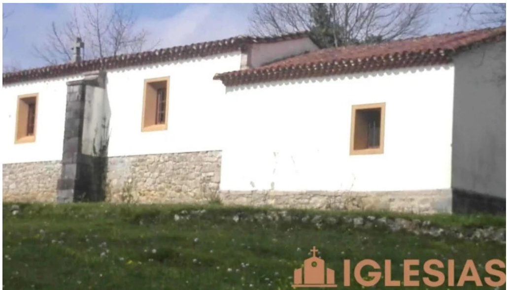
Ermita de san cosme iglesia