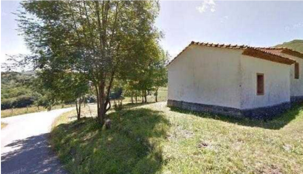
Ermita de san cosme direccion