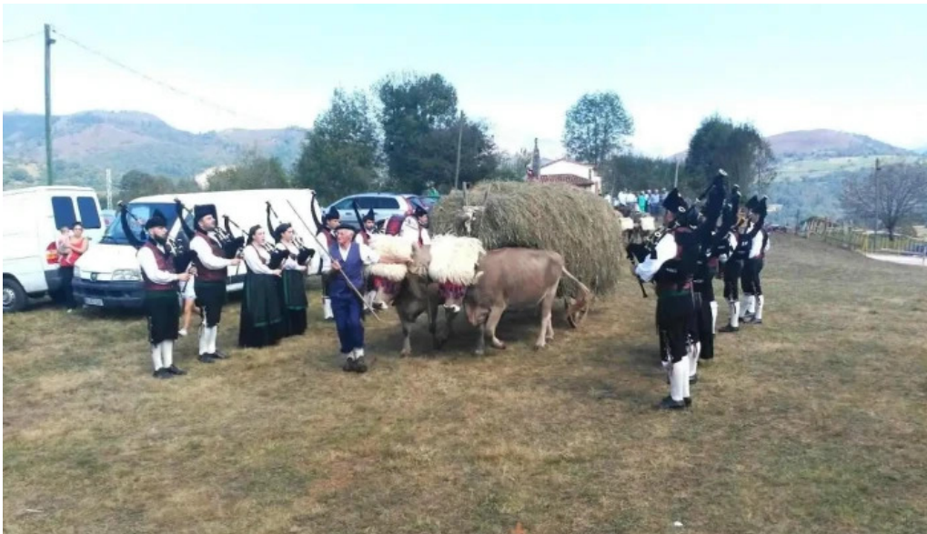
Ermita de san cosme cangas de onis