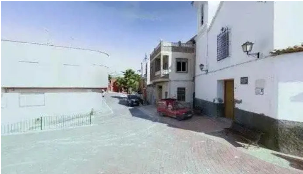
Iglesia vieja promocion