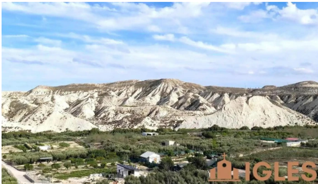
Iglesia vieja campos del rio