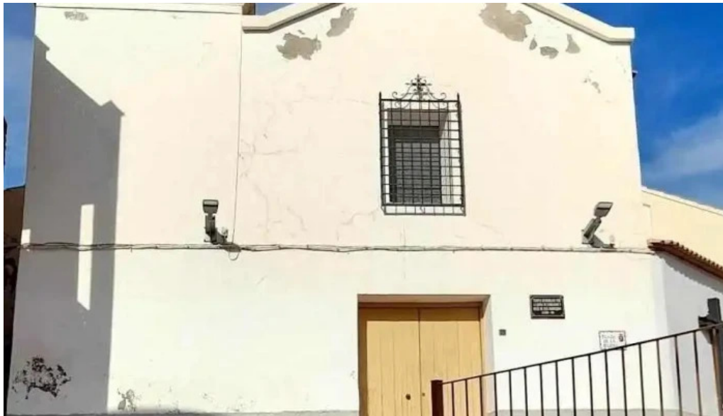
Iglesia vieja iglesia