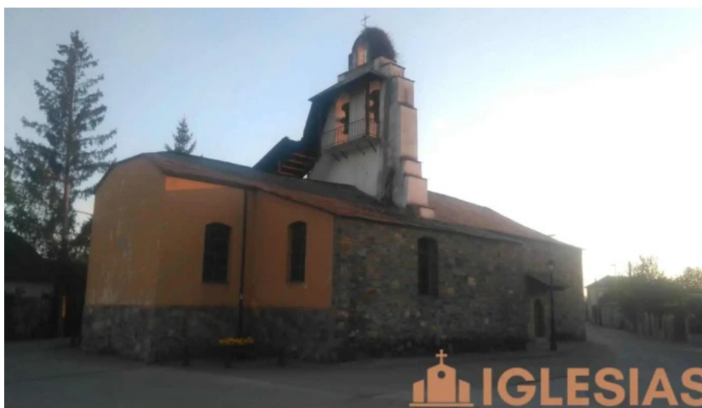
Iglesia de san juan iglesia