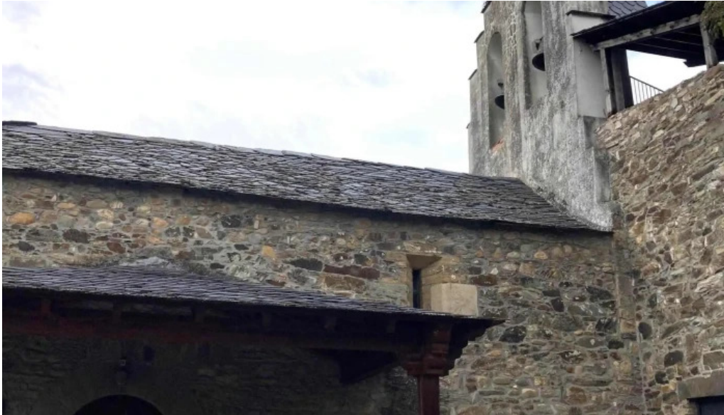
Iglesia de san juan camponaraya