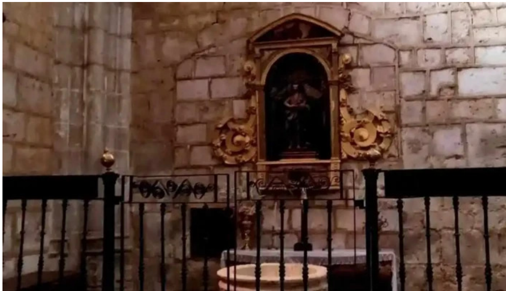
Iglesia de santa eugenia iglesia