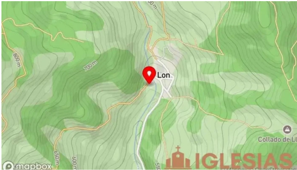
Iglesia de santa eugenia mapa