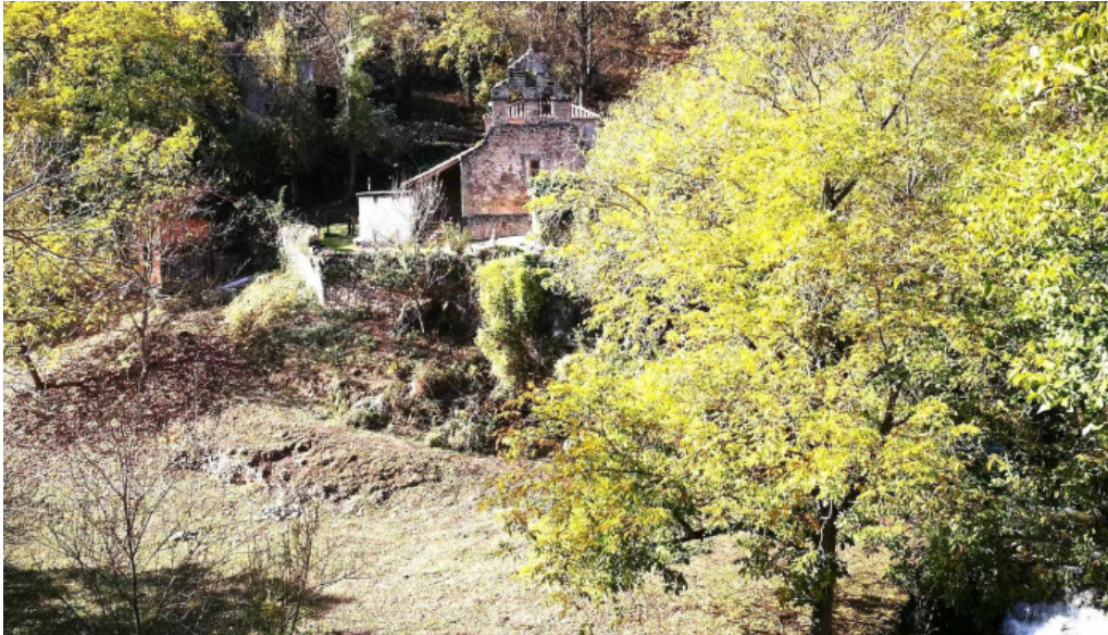
Iglesia de santa eugenia camaleno