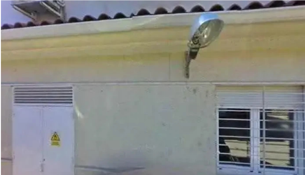
Ermita de san antonio iglesia