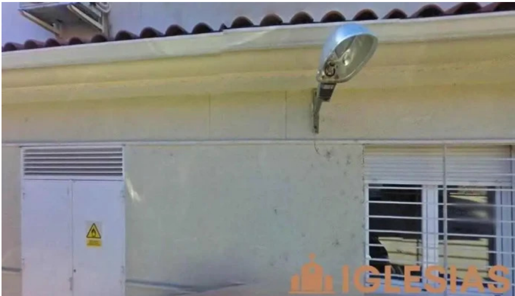
Ermita de san antonio cabezuela del valle