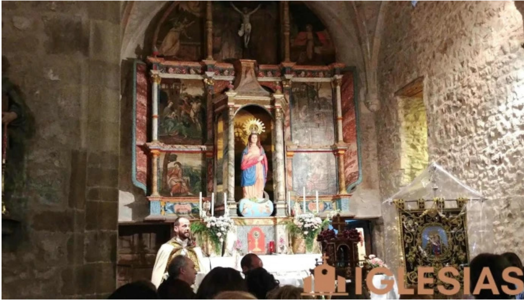
Iglesia de san andres iglesia