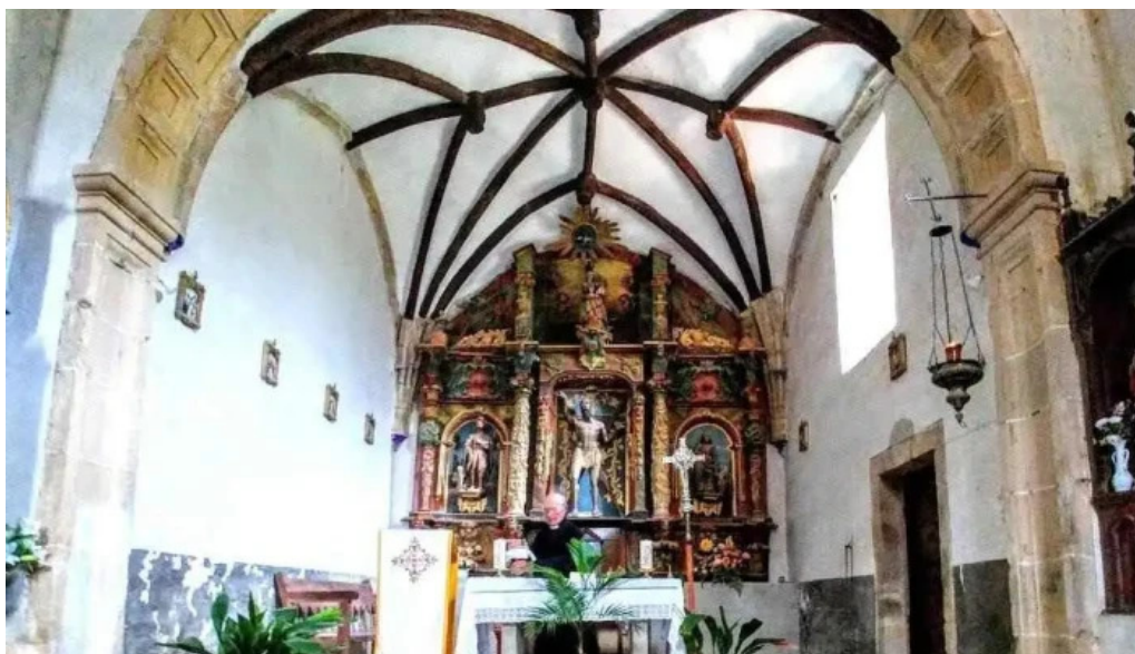
Iglesia de san andres cabezon de liebana