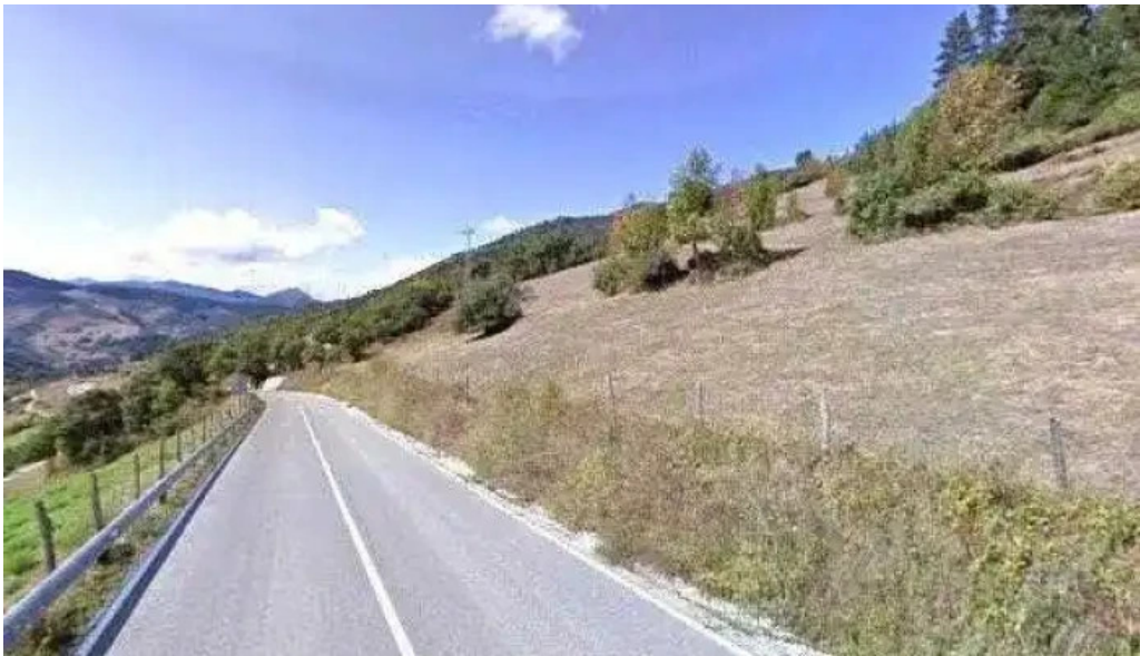
Iglesia de san andres direccion