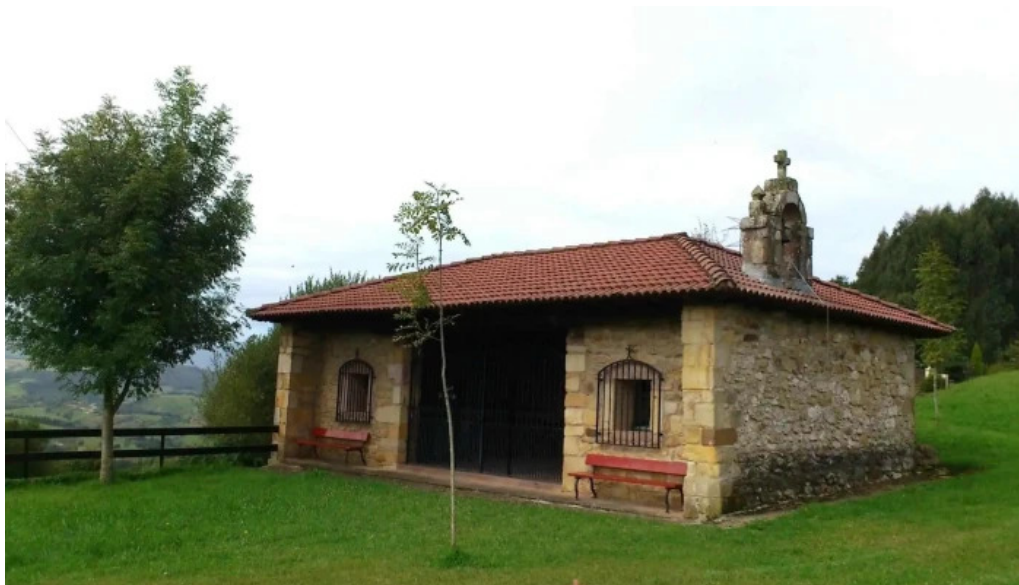
Ermita de san roque iglesia