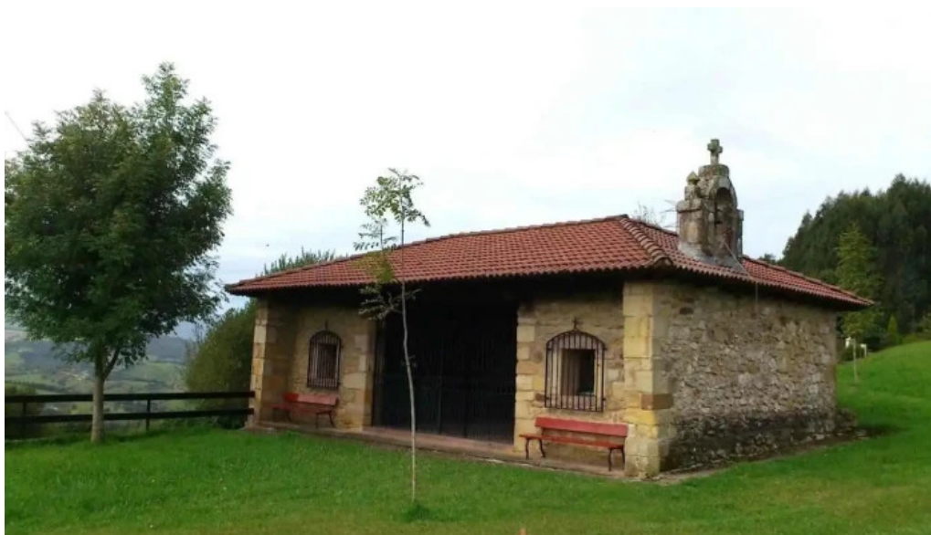
Ermita de san roque cabezon de la sal