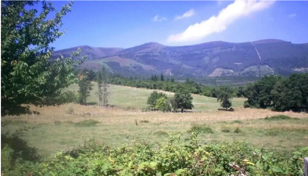
Iglesia de san esteban burcena