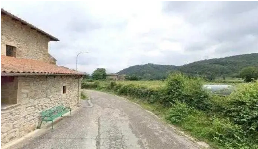
Iglesia de san esteban direccion