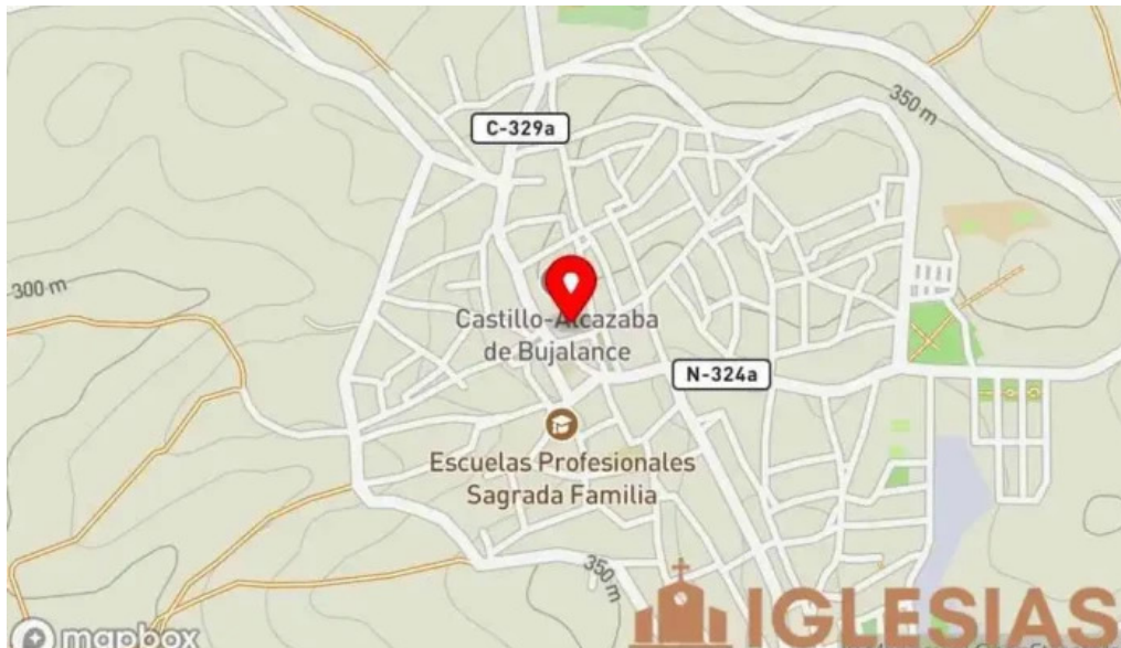
Iglesia de ntra sra de la asuncion mapa