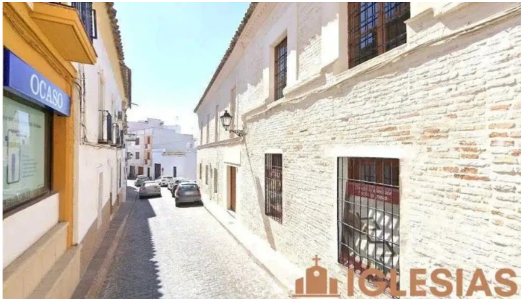
Iglesia de ntra sra de la asuncion bujalance