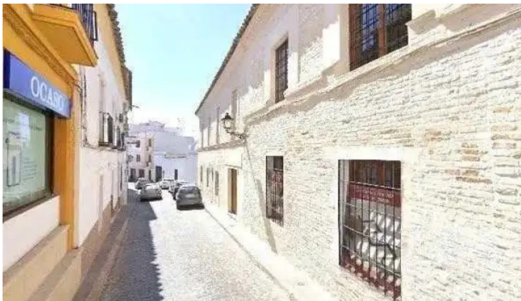
Iglesia de ntra sra de la asuncion iglesia