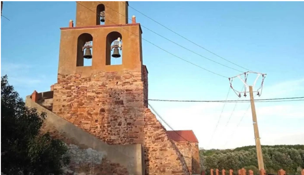
Iglesia de la conversion de san pablo bretocino