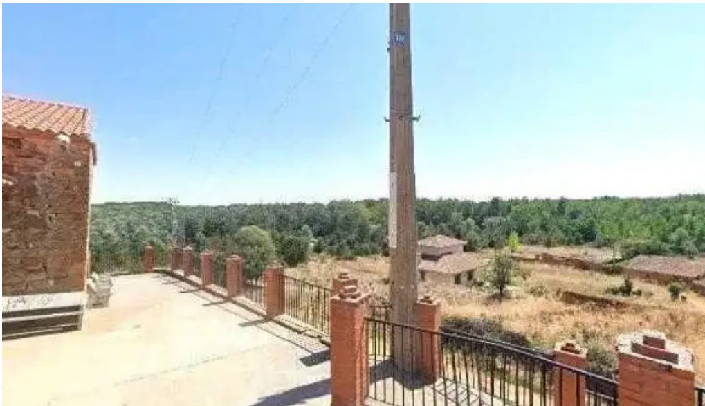
Iglesia de la conversion de san pablo puntaje