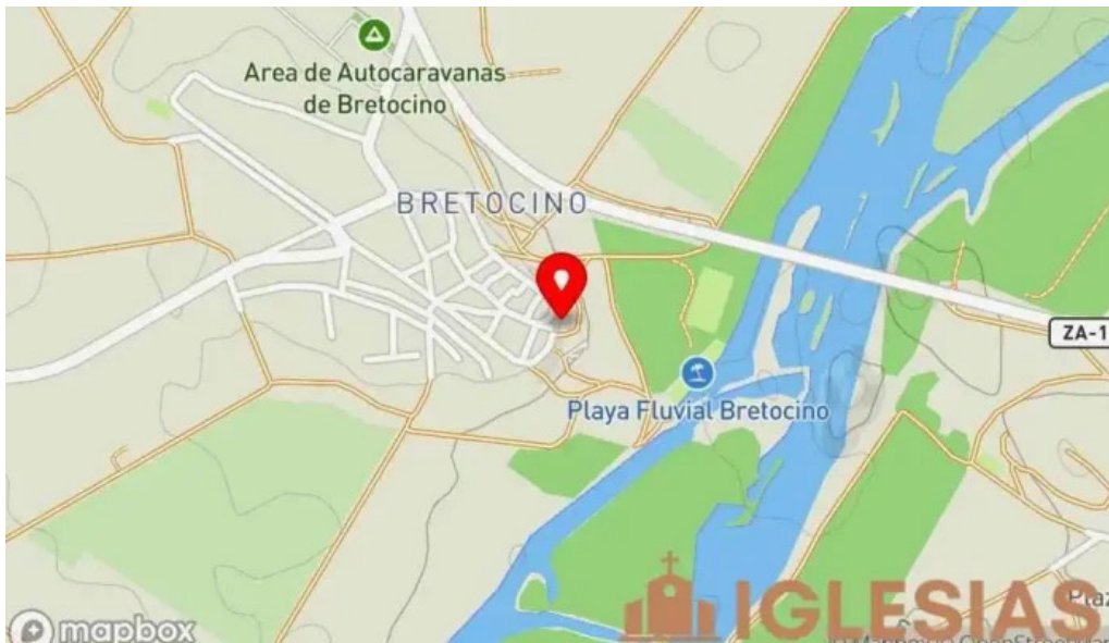
Iglesia de la conversion de san pablo mapa