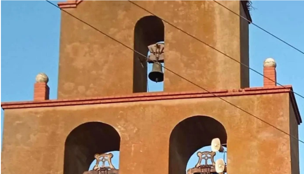
Iglesia de la conversion de san pablo iglesia