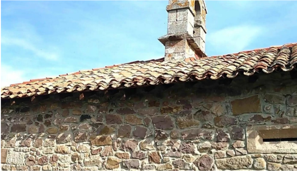
Ermita de san roque abierto ahora