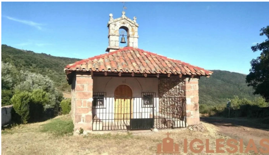
Ermita de san roque iglesia