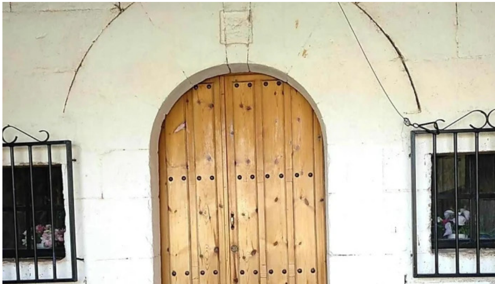
Ermita de san roque horario