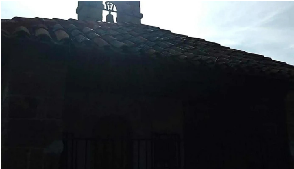
Ermita de san roque telefono