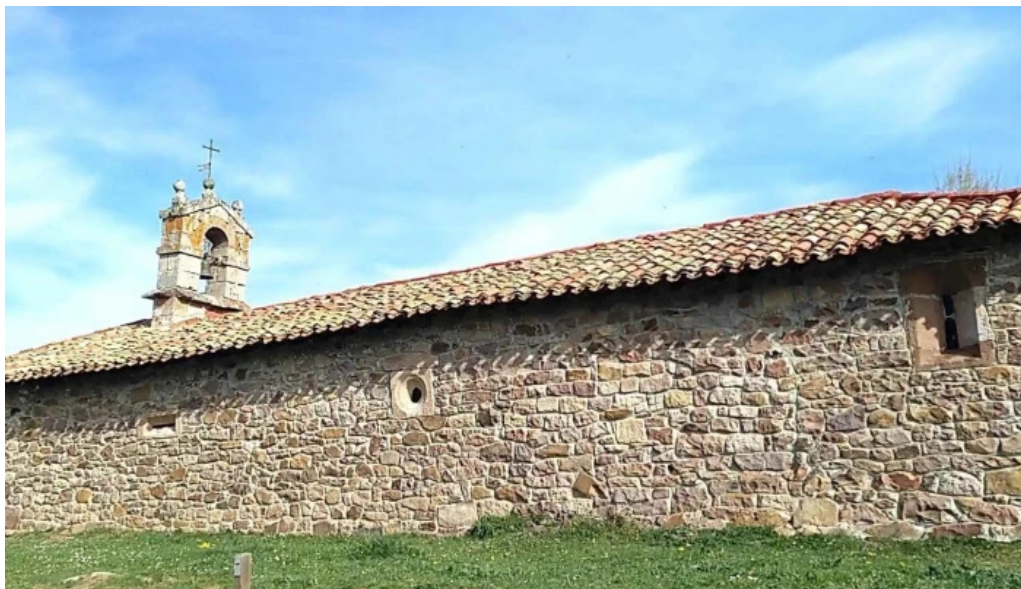
Ermita de san roque branosera