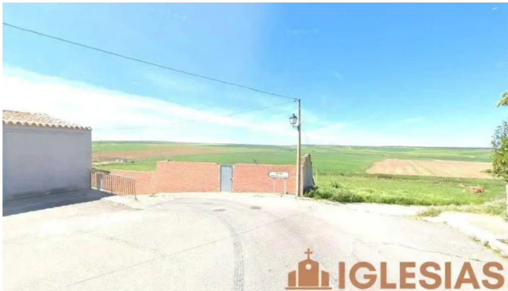
Iglesia parroquial de san millan blascomillan