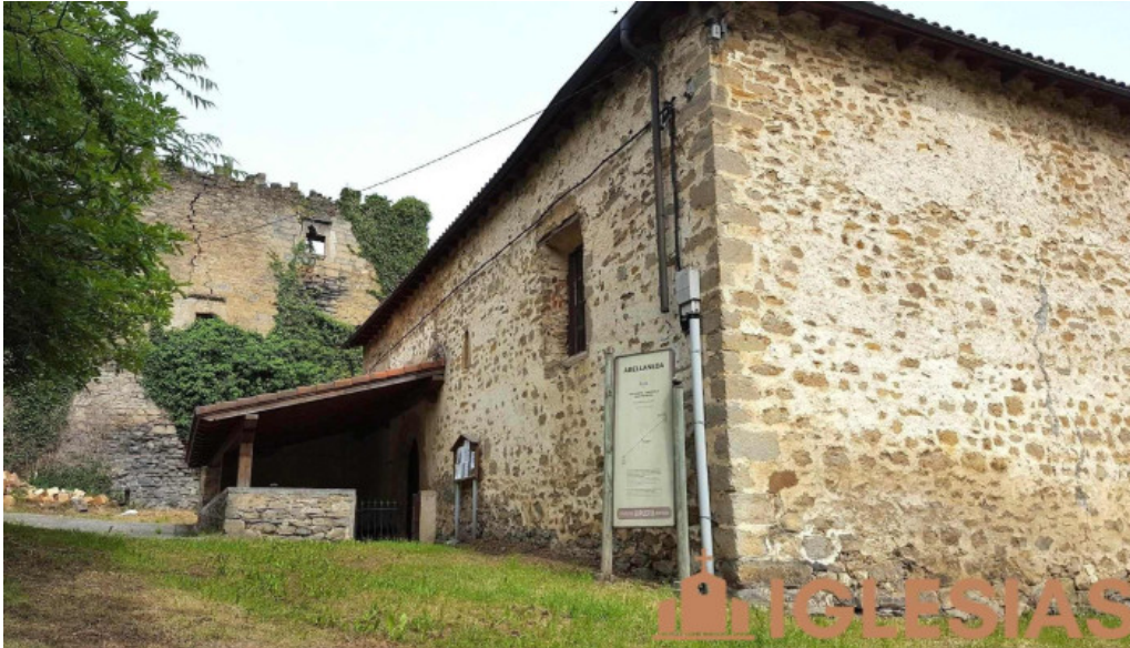
Iglesia de san bartolome iglesia