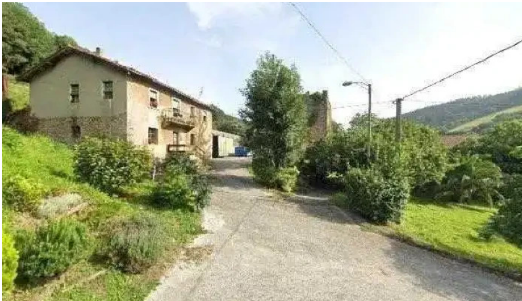
Iglesia de san bartolome direccion