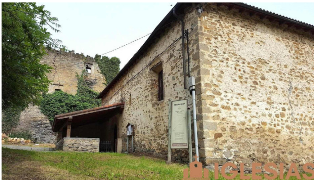
Iglesia de san bartolome biscay