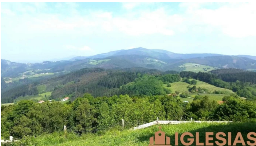
Ermita de santa gurutze iglesia