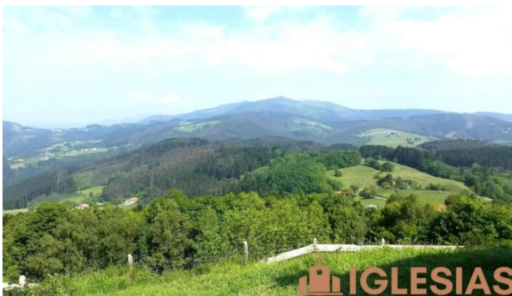
Ermita de santa gurutze biscay