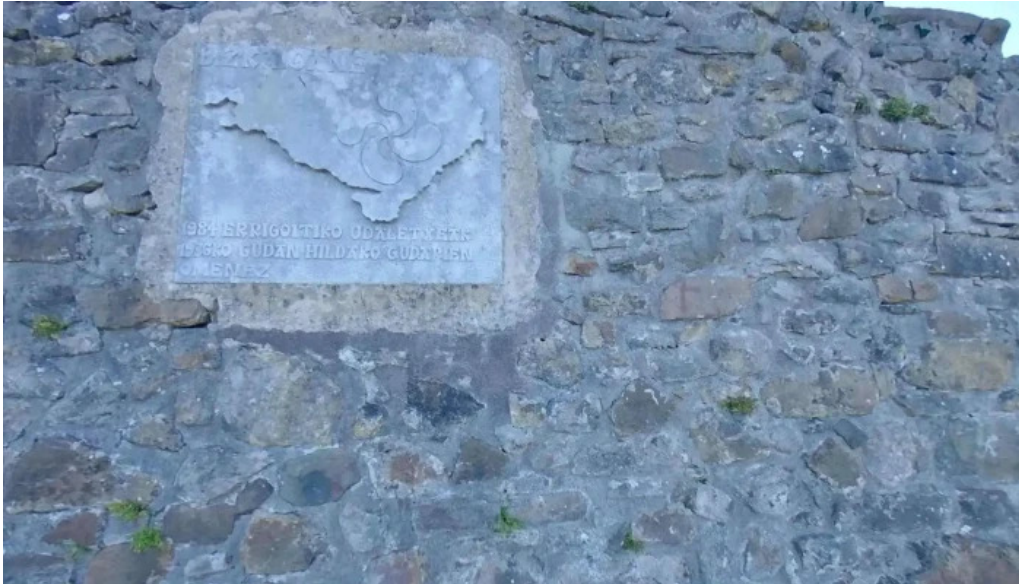
Ermite de santa gurutze zona