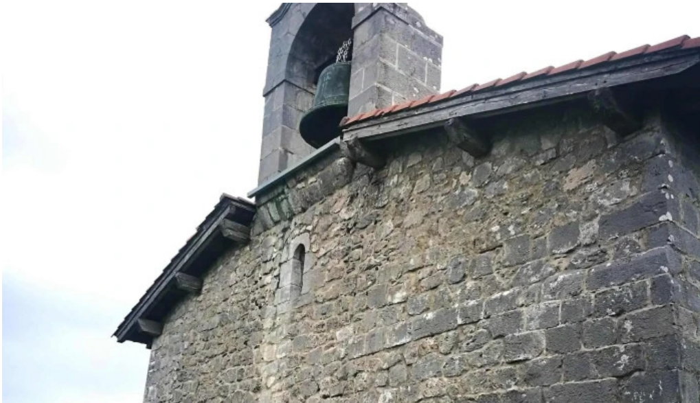
Ermita de santa engracia biscay