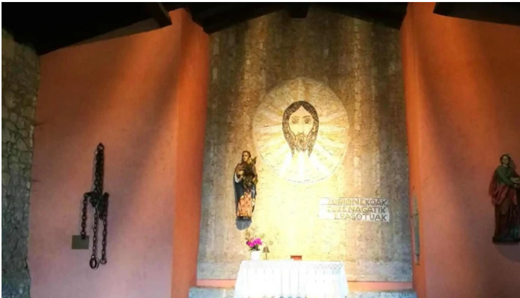
Ermita de santa engracia telefono