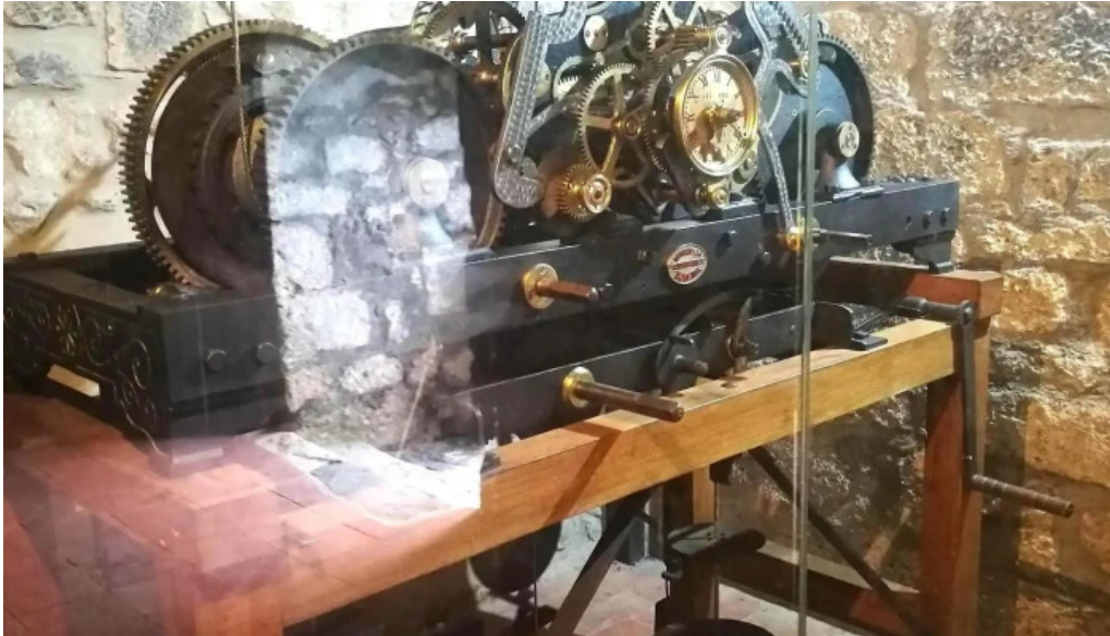
Ermita de santa engracia horario