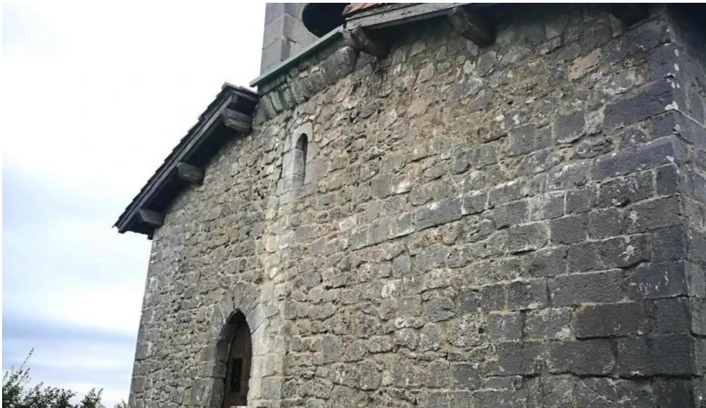
Ermita de santa engracia iglesia