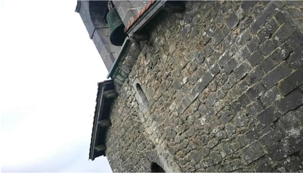
Ermita de santa engracia ubicacion