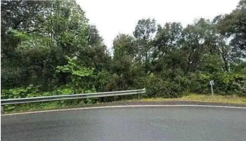
Ermita de santa cruz bo mendexu iglesia