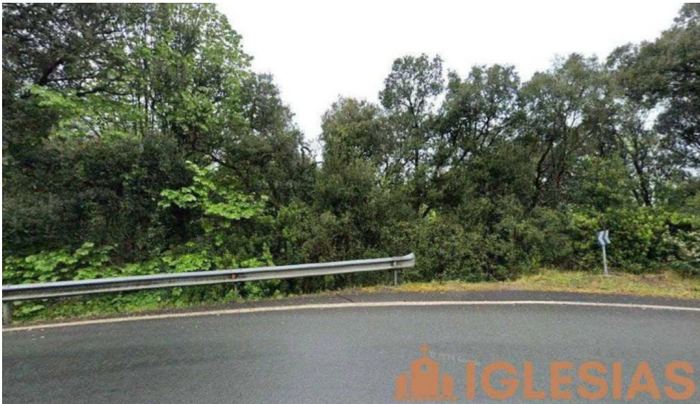
Ermitea de santa cruz bº mendexu biscay