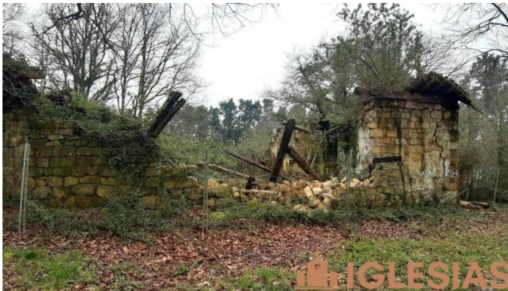
Ermita de san juan ruinas iglesia