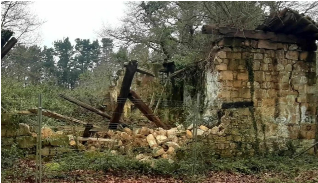
Ermita de san juan ruinas biscay