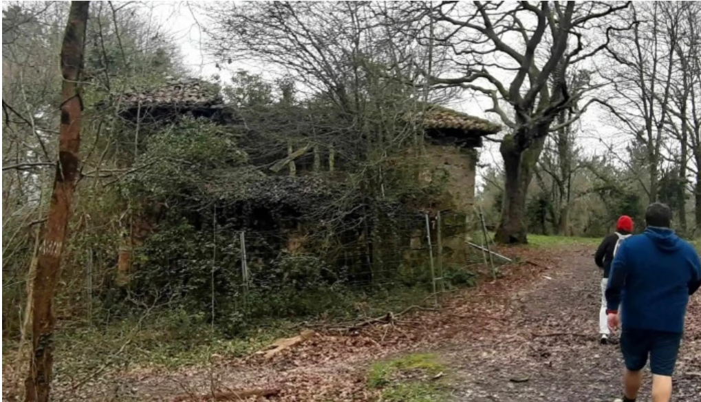
Ermita de san juan ruinas descuentos