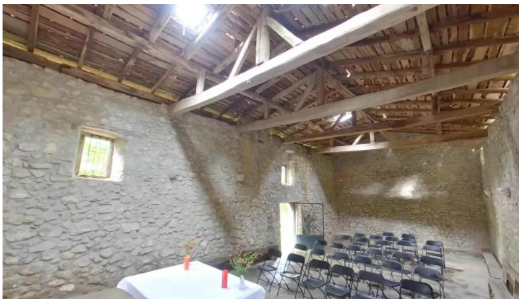
Ermita de san antolin horario