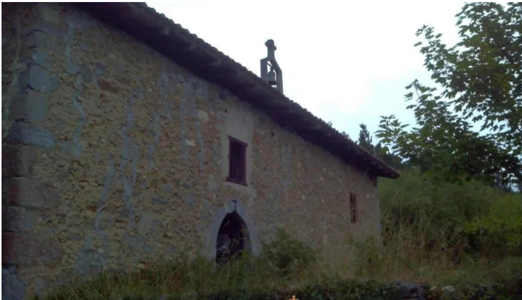
Ermita de san antolin iglesia