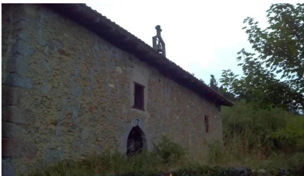
Ermita de san antolin biscay