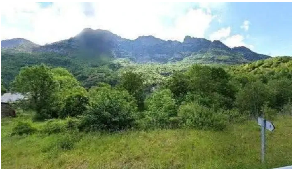
Iglesia de san martin instagram