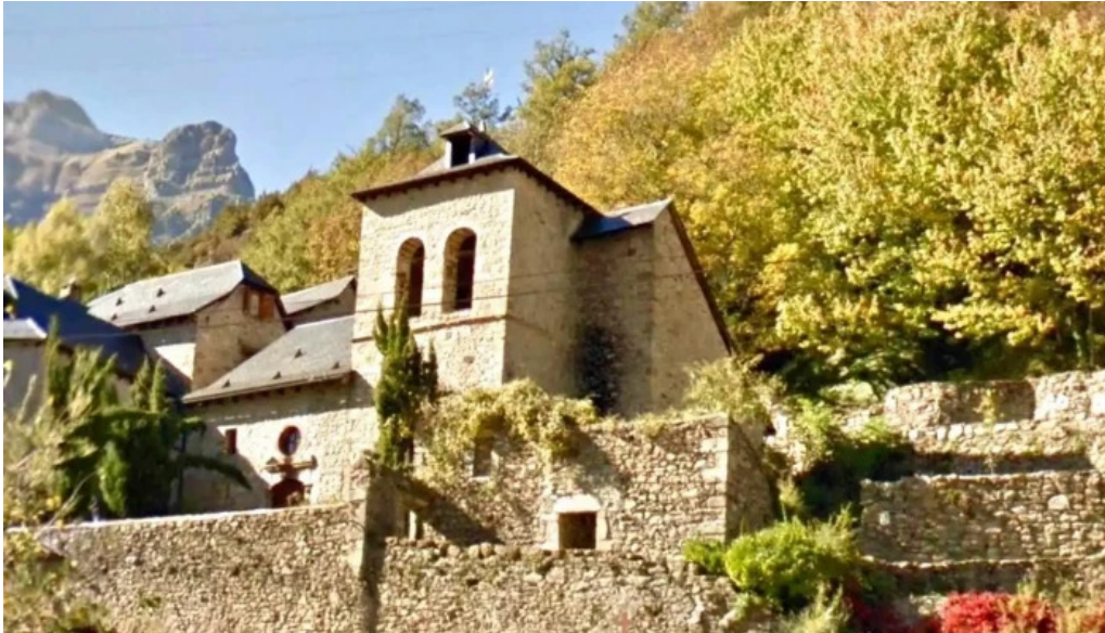
Iglesia de san martin iglesia