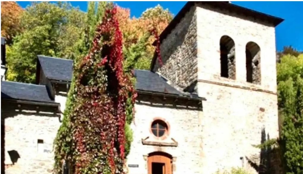
Iglesia de san martin biescas