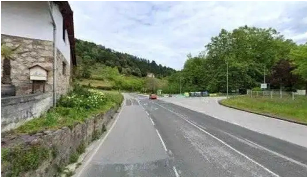
Gardotxa ermita basaeliza iglesia