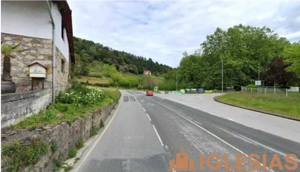
Gardotxa ermita basaeliza berriatua