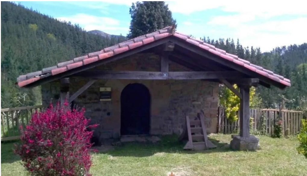
Ermita de san salvador de berreno munitibar berreno