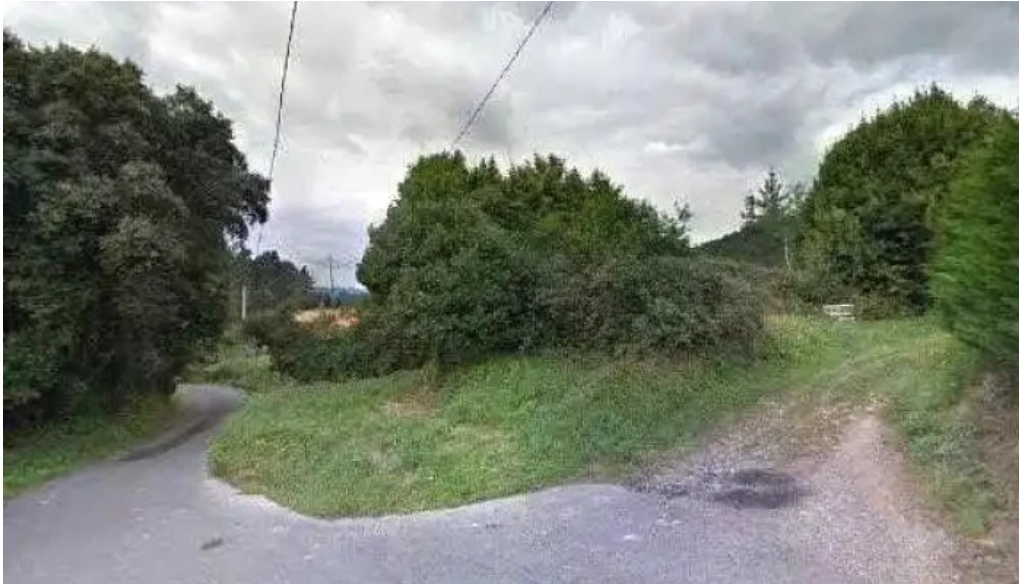
Ermita de san salvador de berreno munitibar cerca de mi