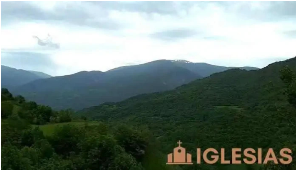
Santa maria de bernui videos