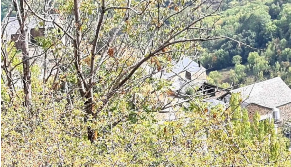
Santa maria de bernui zona