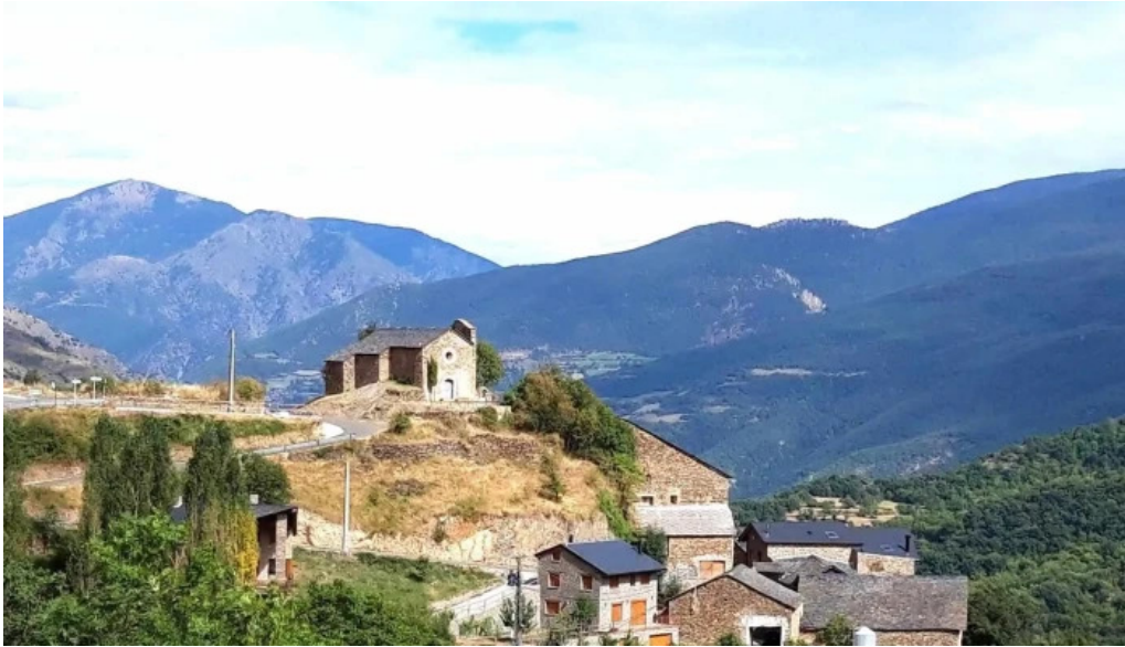
Santa maria de bernui numero