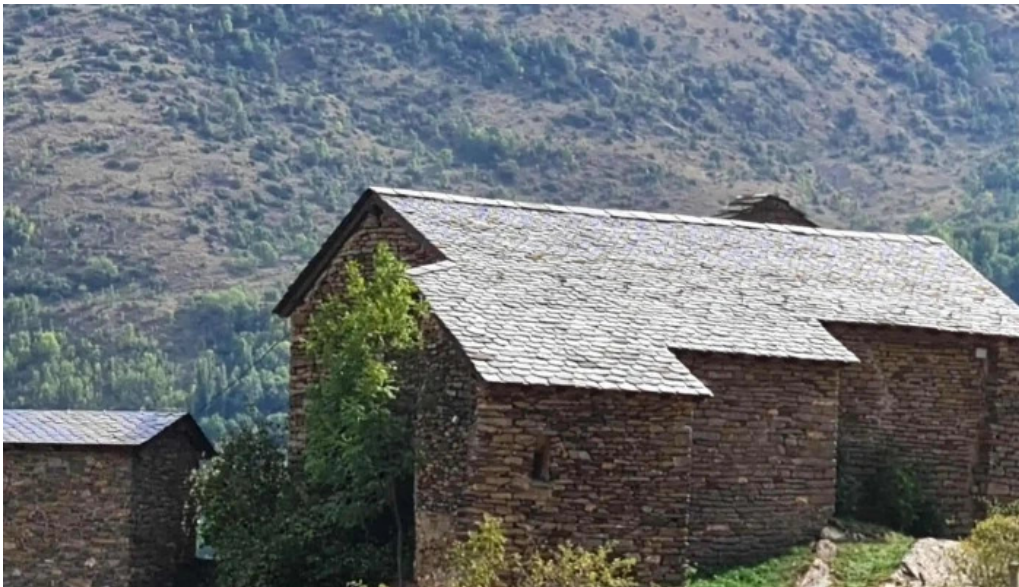
Santa maria de bernui donde