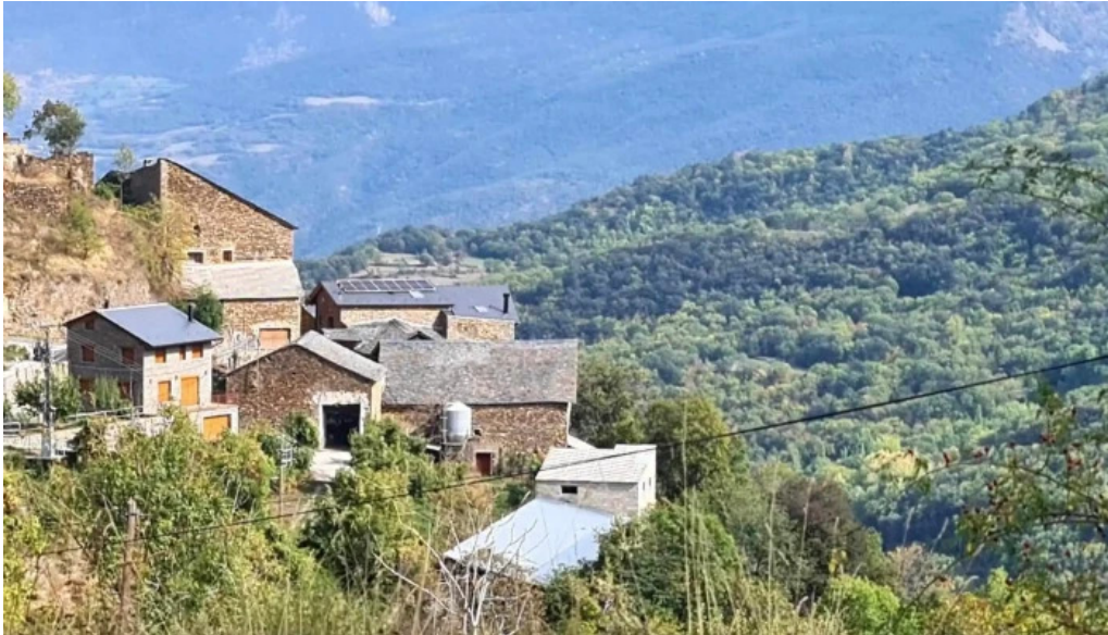
Santa maria de bernui bernui