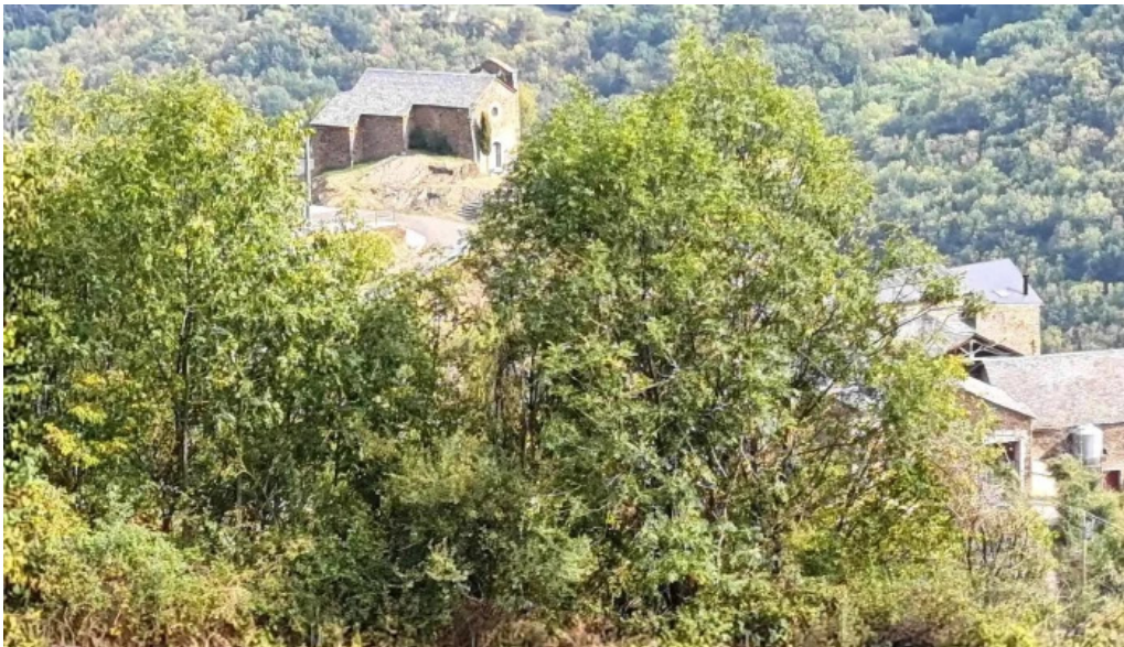
Santa maria de bernui abierto ahora