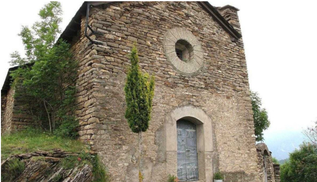
Santa maria de bernui iglesia