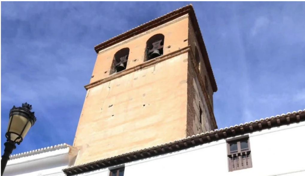
Templo de ntrasra de la piedad baza