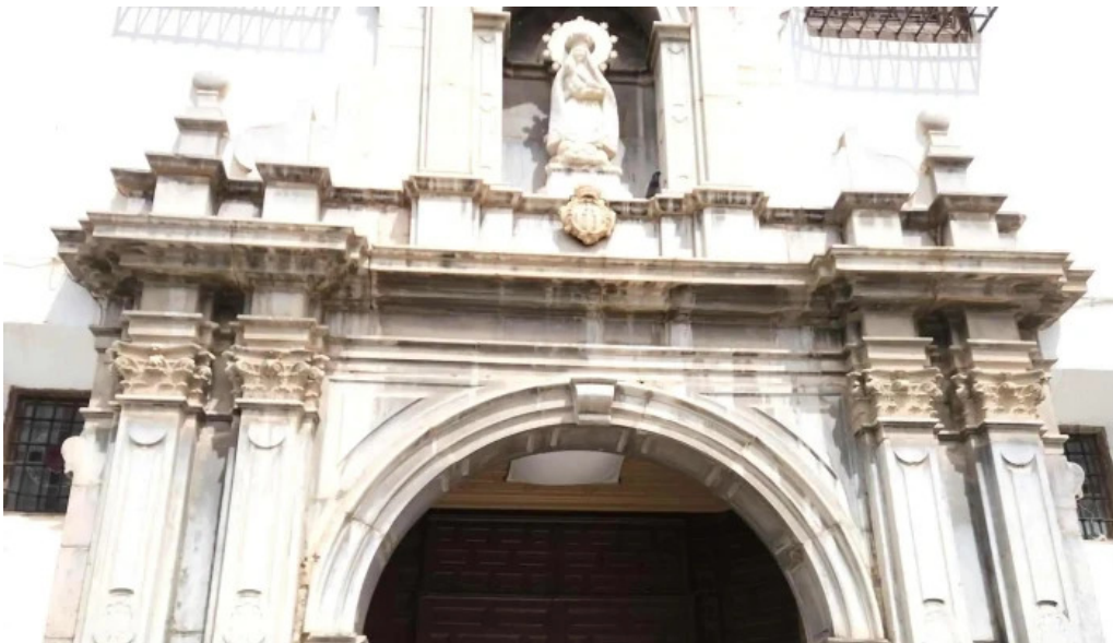
Templo de ntrasra de la piedad puntaje