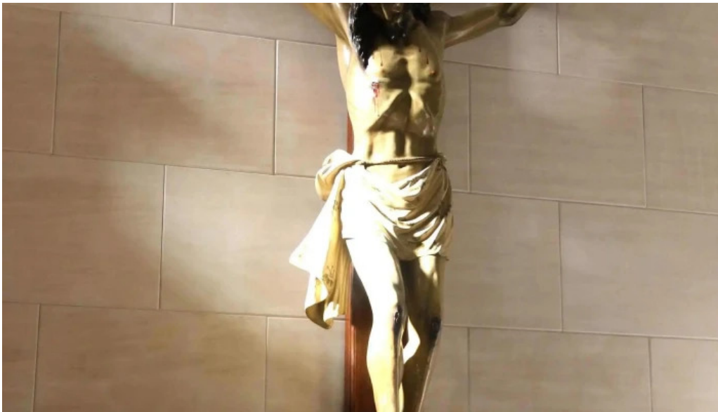
Templo de ntrasra de la piedad numero