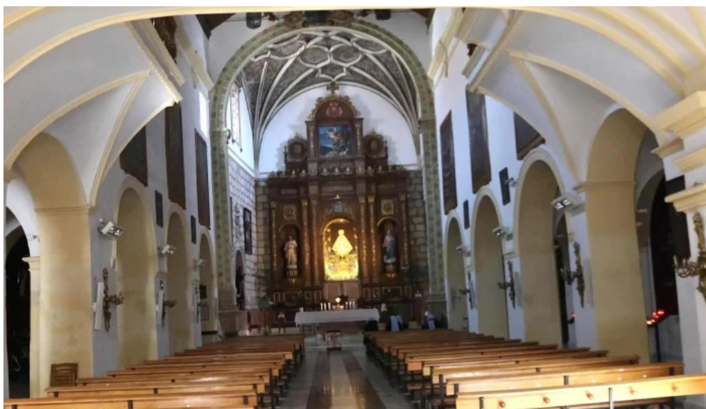
Templo de ntrasra de la piedad videos