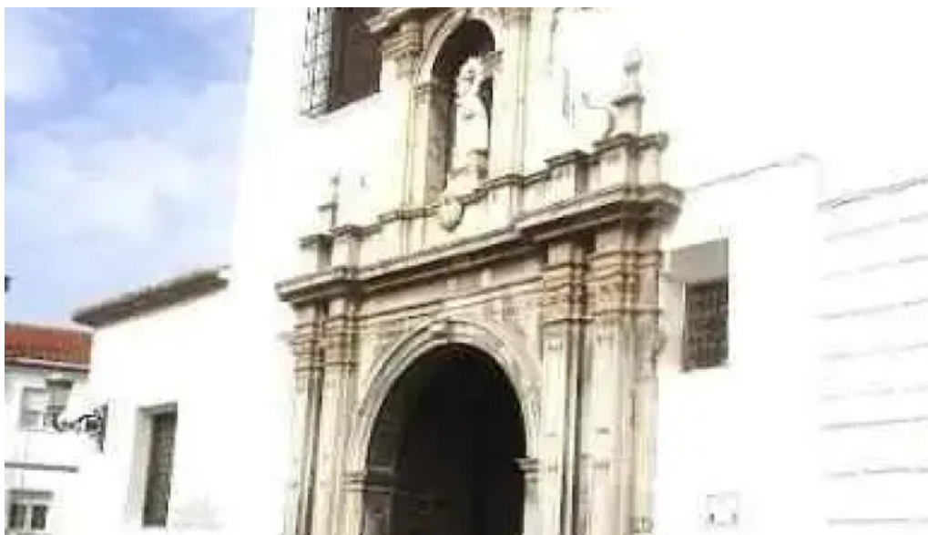
Templo de ntra sra de la piedad baza