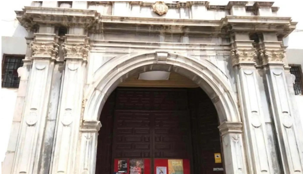
Templo de ntrasra de la piedad iglesia