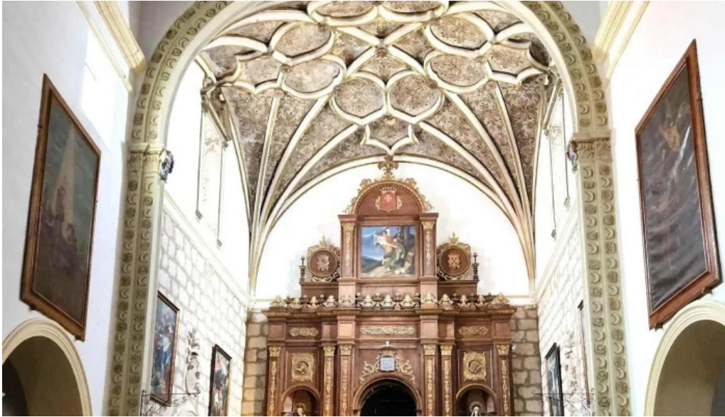
Templo de ntrasra de la piedad comentarios