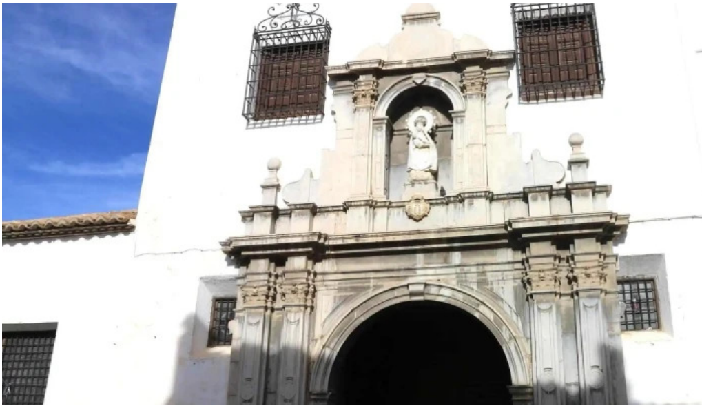
Templo de ntrasra de la piedad ubicacion