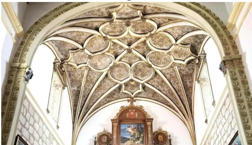
Templo de ntrasra de la piedad zona