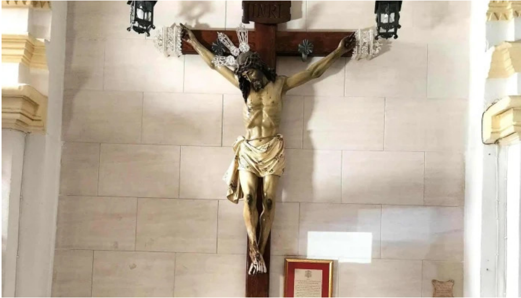
Templo de ntrasra de la piedad precios