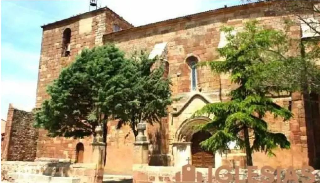
Iglesia de san miguel arcangel iglesia