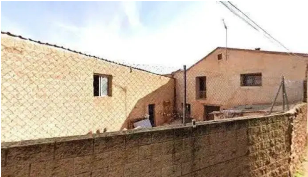
Iglesia de san miguel arcangel barcones