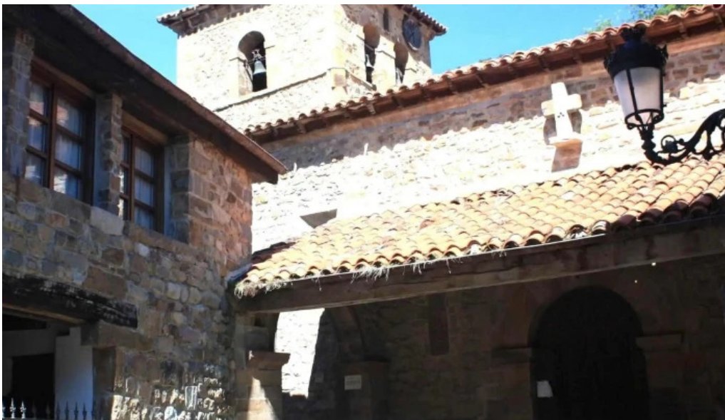
Iglesia de santa maria comentarios