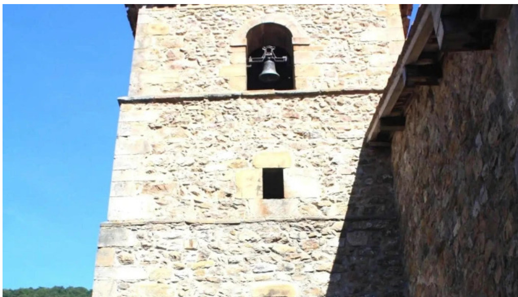
Iglesia de santa maria barcena mayor