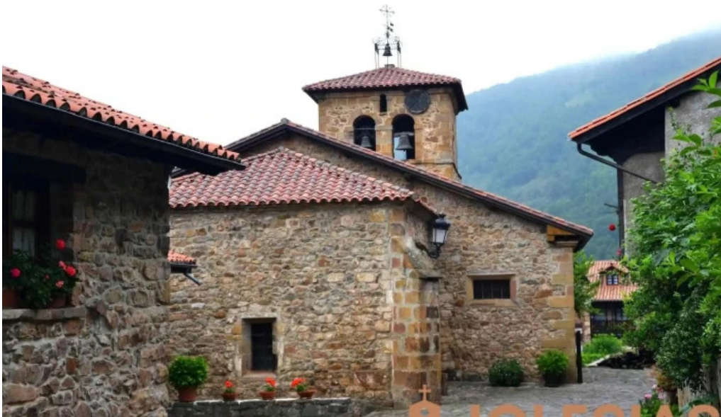
Iglesia de santa maria iglesia