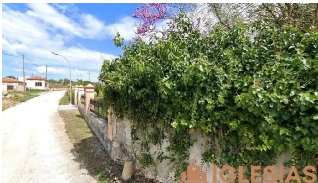
Esglesia de sant sepulcre barcelona