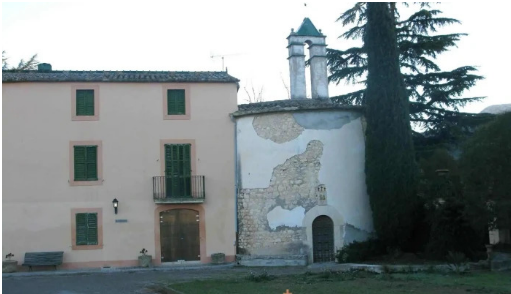
Esglesia de sant sepulcre iglesia