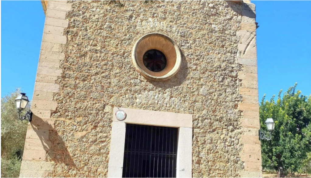
Ermita des coco zona