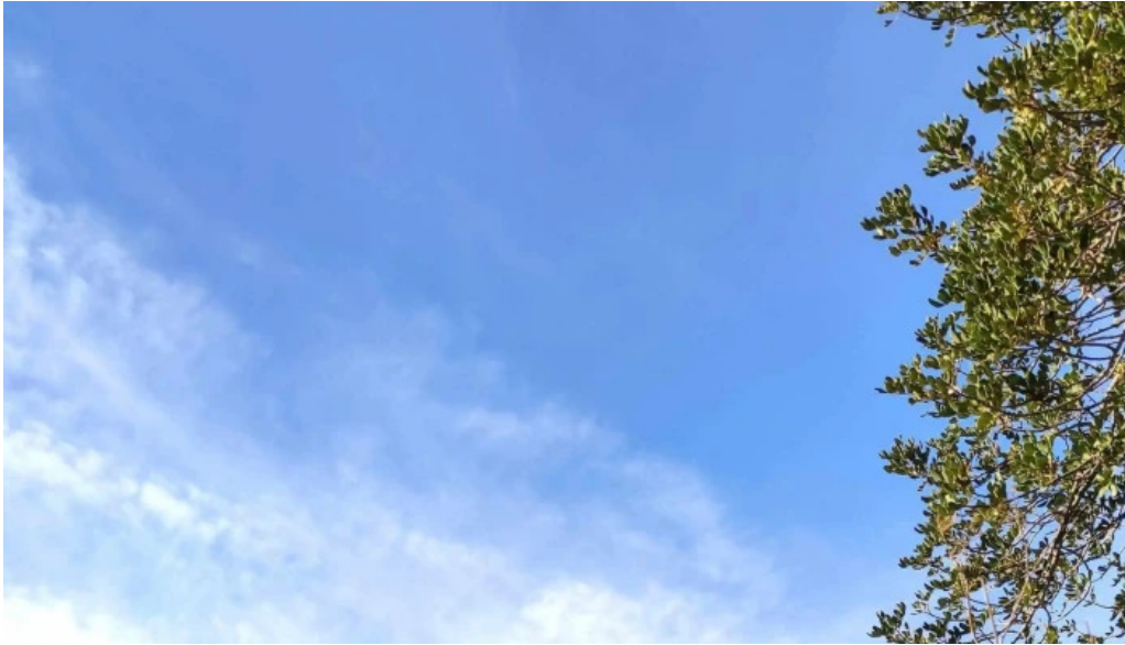
Ermita des coco puntaje