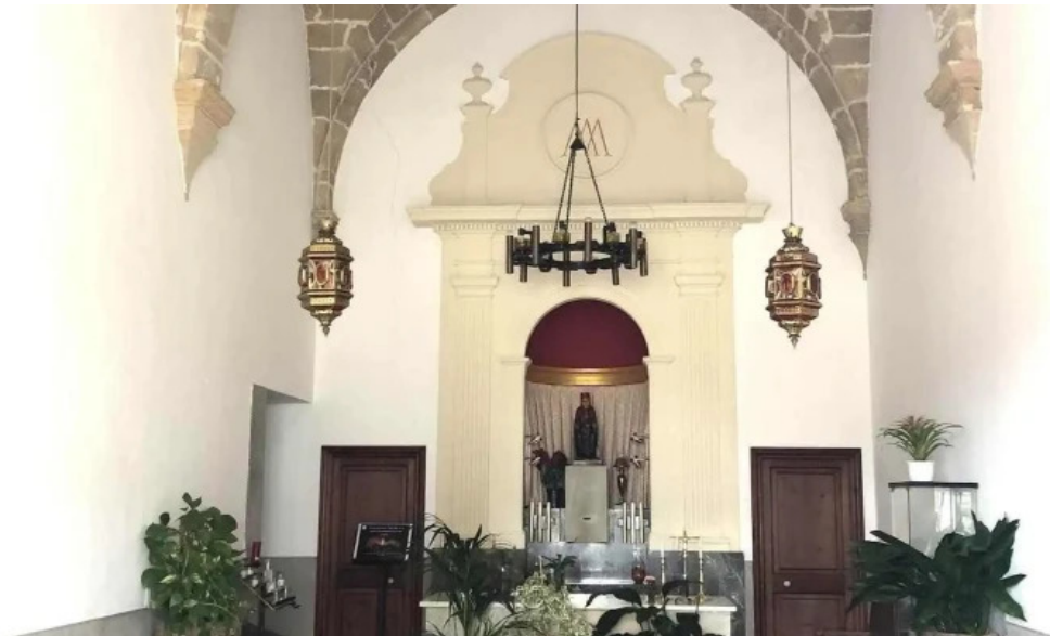
Ermita des coco iglesia