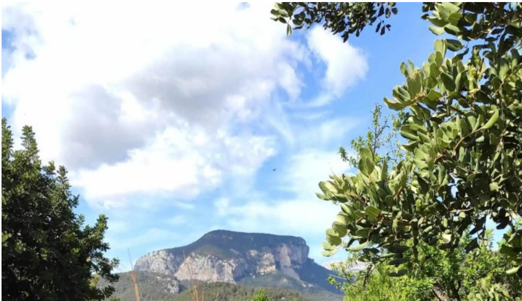
Ermita des coco sitio web