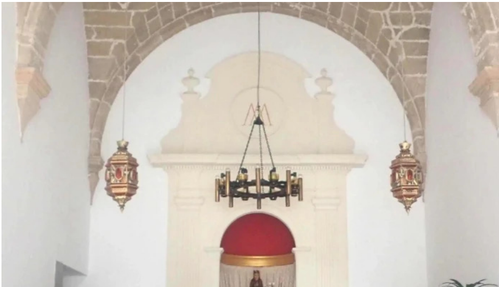
Ermita des coco como llegar