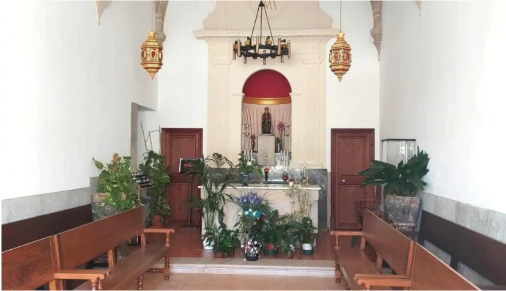
Ermita des coco descuentos