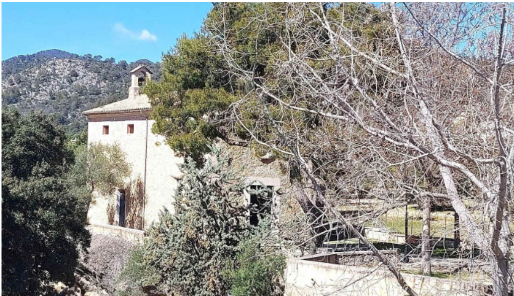
Ermita des coco balearic islands