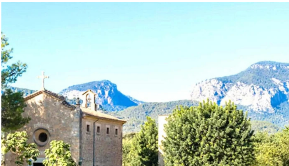
Ermita des coco abierto ahora