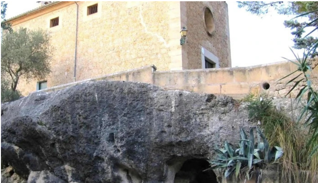
Ermita des coco donde