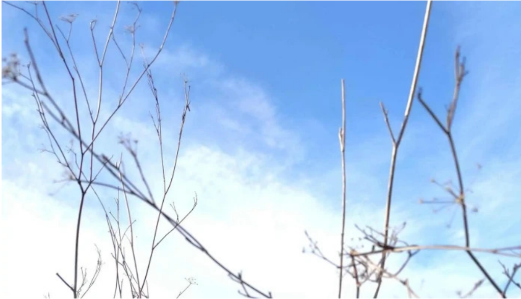
Ermita des coco cerca de mi