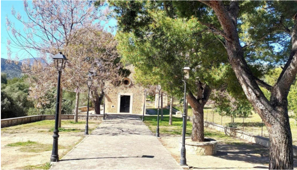
Ermita des coco horario