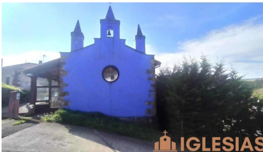
Ermita de san bernardo iglesia