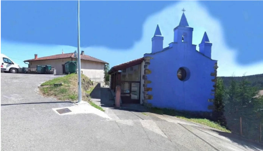
Ermita de san bernardo horario