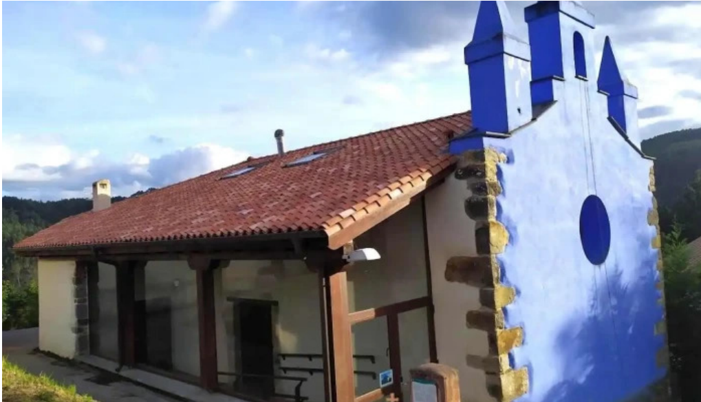
Ermita de san bernardo baldatika