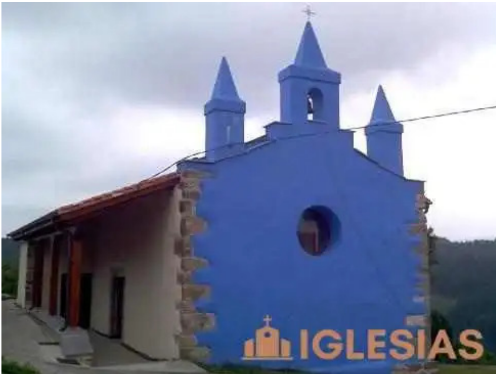
Ermita de san bernardo forua