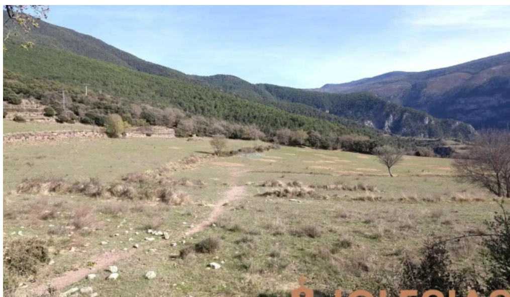
Sant benet del pui iglesia