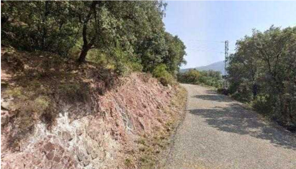
Sant benet del pui direccion