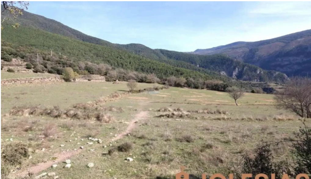
Sant benet del pui baen