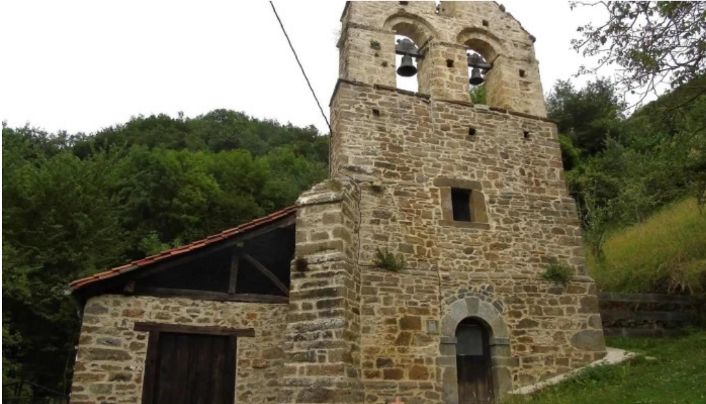
Iglesia de santa eulalia iglesia