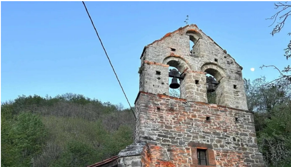
Iglesia de santa eulalia avellanedo