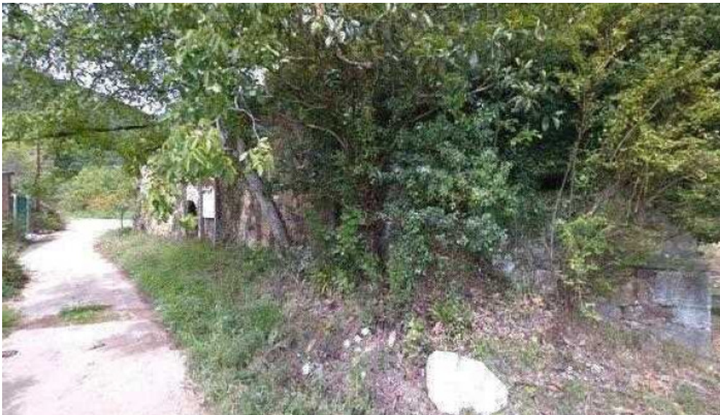
Iglesia santa maria de la nieves asturias