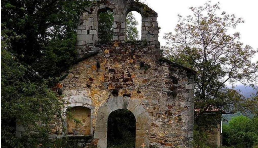
Iglesia santa maria de la nieves iglesia