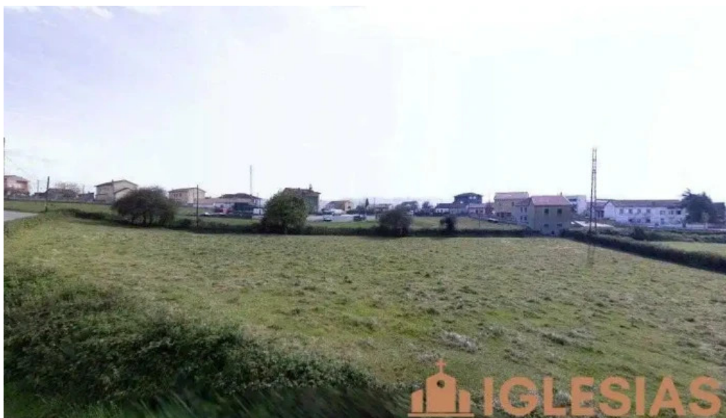
Iglesia de san miguel de la barreda asturias