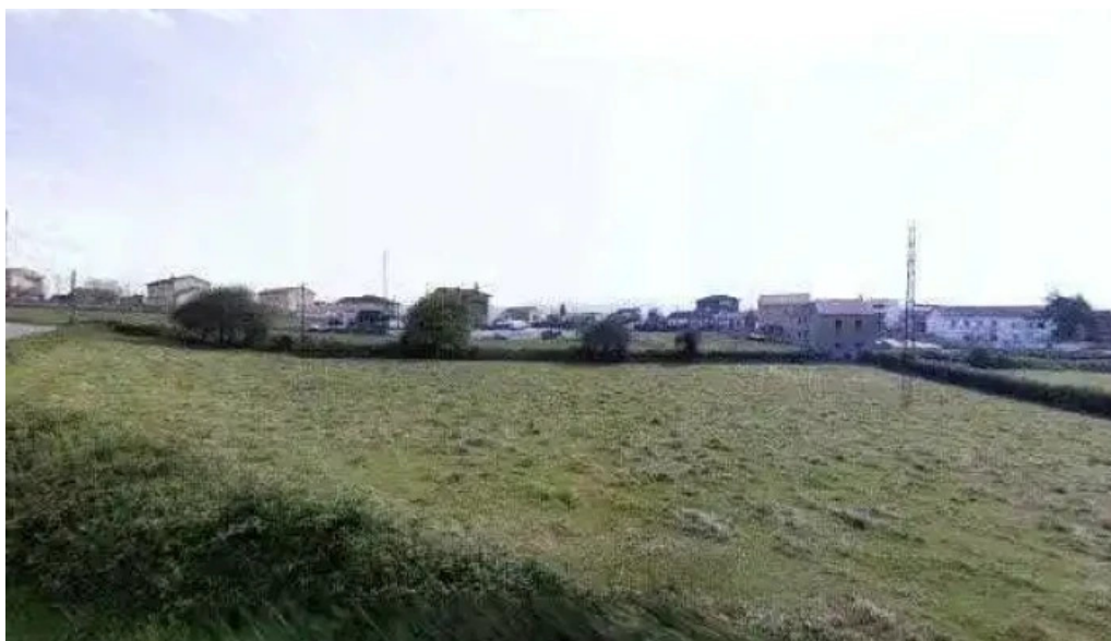
Iglesia de san miguel de la barreda iglesia