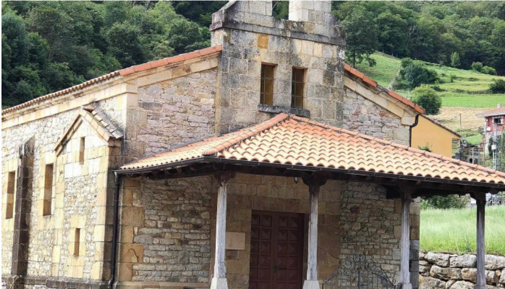
Iglesia de san juan asturias