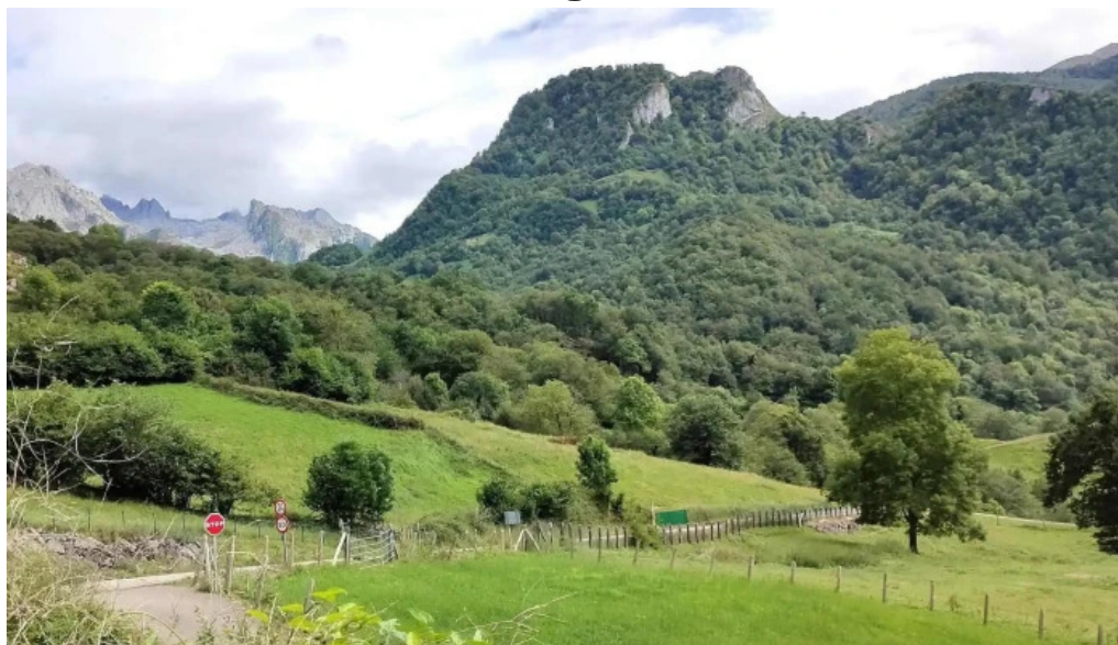
Iglesia de san juan precios