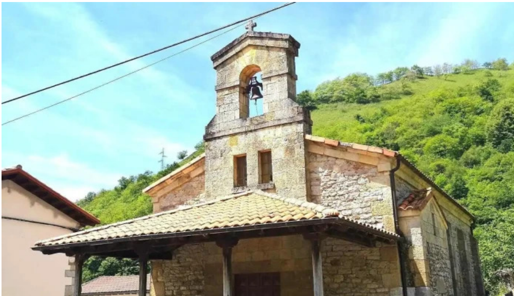
Iglesia de san juan iglesia