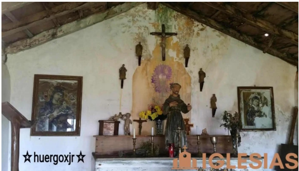
Ermita de san francisco san pachu iglesia