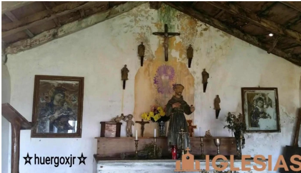
Ermita de san francisco san pachu asturias