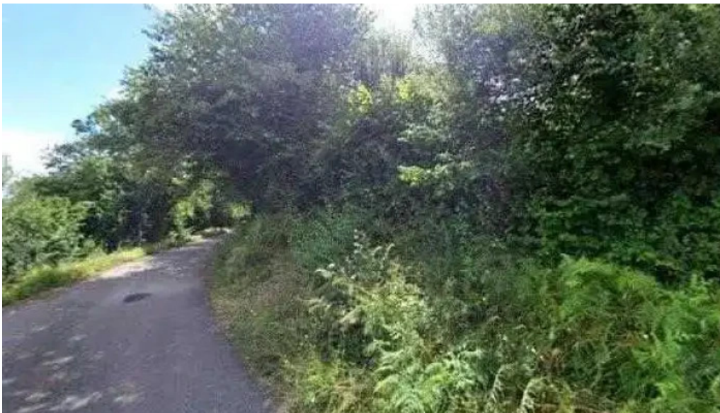
Ermita de san francisco san pachu telefono