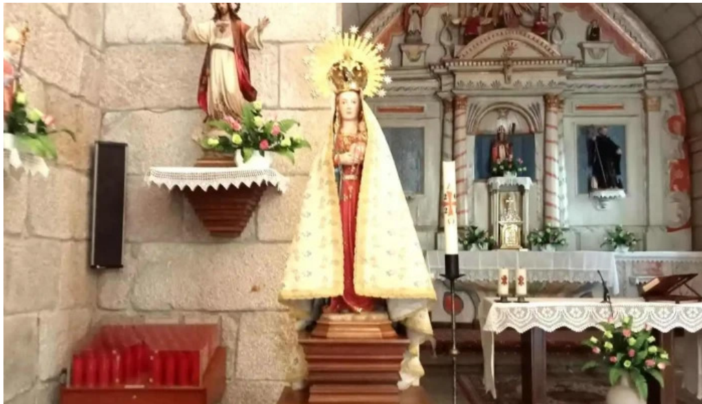
Iglesia de san cibran de ribarteme iglesia