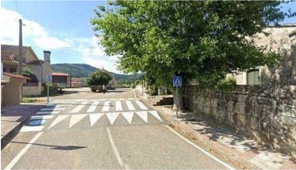
Iglesia de san cibrán de ribarteme sitio web