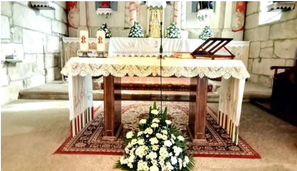
Iglesia de san cibrán de ribarteme recientes