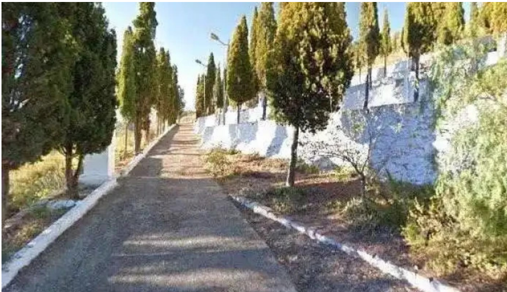
Calvario de artana iglesia