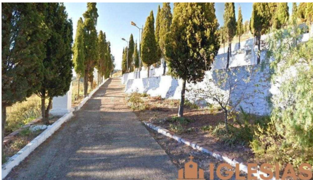
Calvario de artana artana