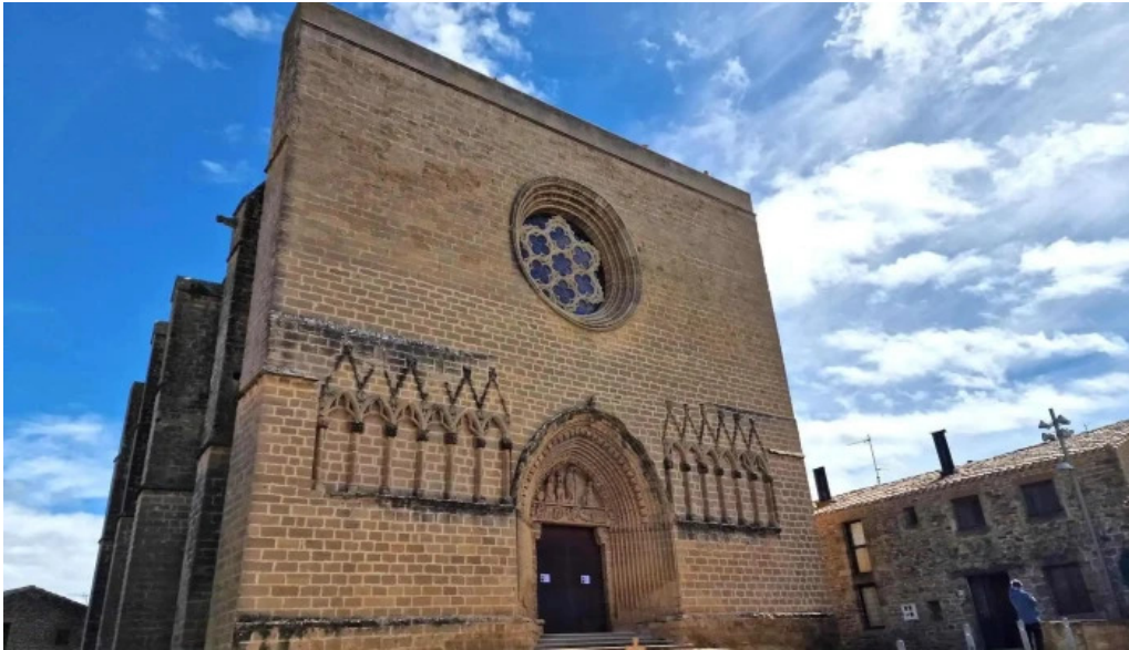
Iglesia fortaleza de san saturnino iglesia