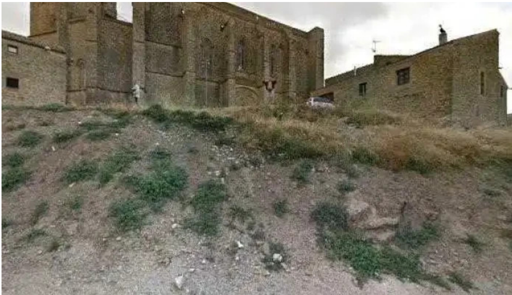
Iglesia fortaleza de san saturnino abierto ahora