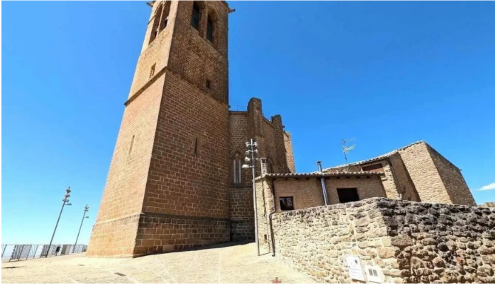
Iglesia fortaleza de san saturnino artajona