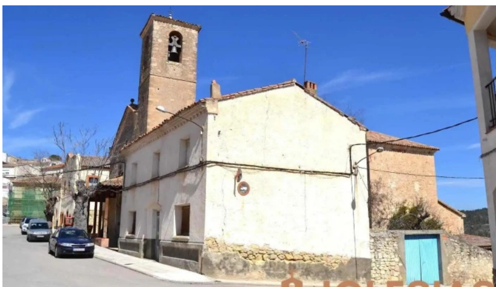
Iglesia de san lorenzo martir arguisuelas