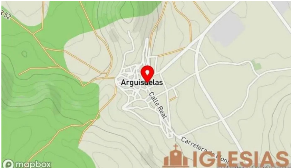
Iglesia de san lorenzo martir mapa