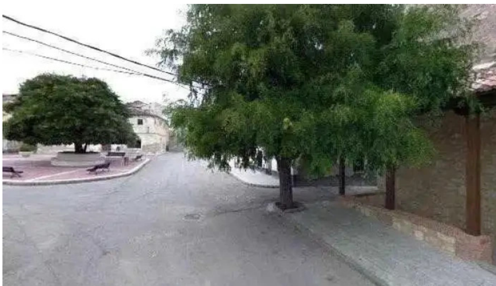
Iglesia de san lorenzo martir donde