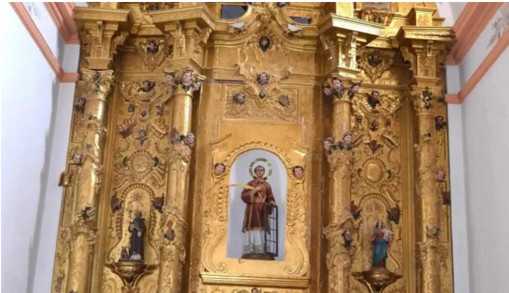
Iglesia de san lorenzo martir iglesia