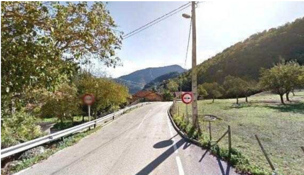
Iglesia de san adriano iglesia