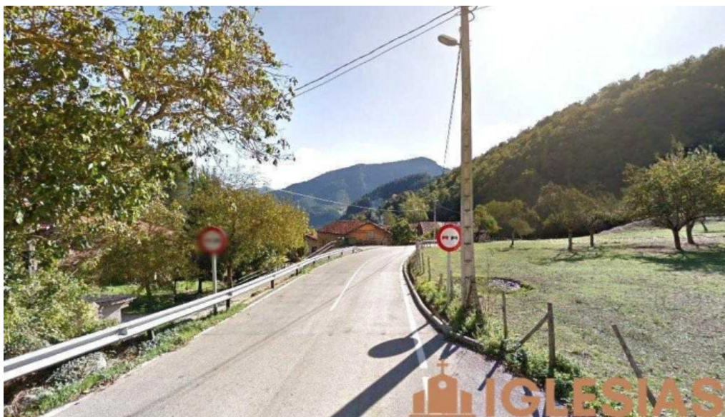
Iglesia de san adriano arguebanes