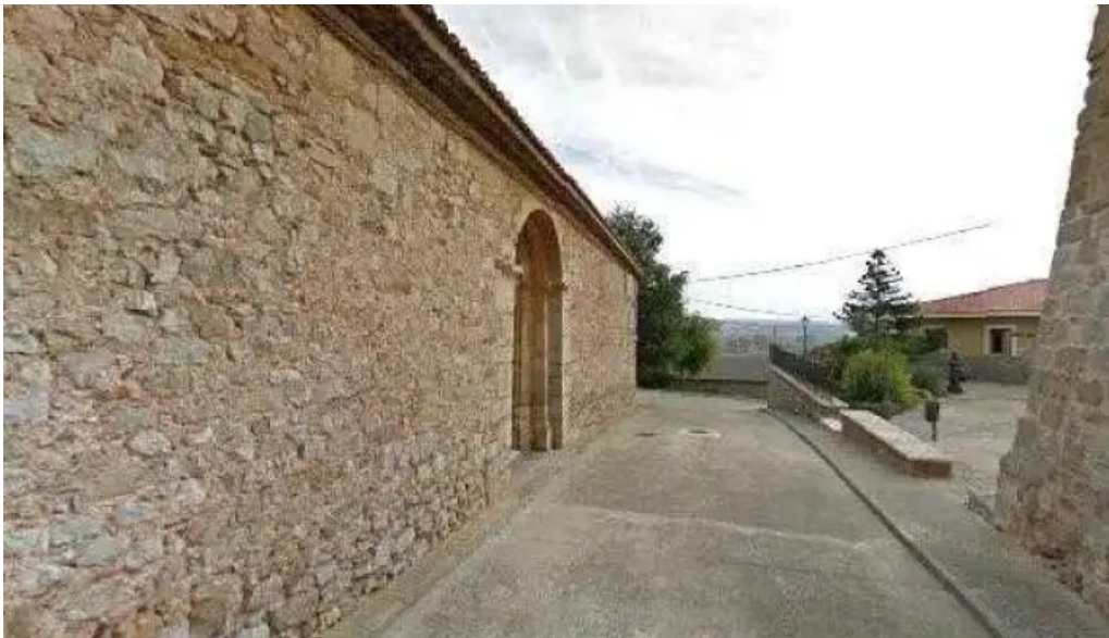
Iglesia fortificada de argente iglesia