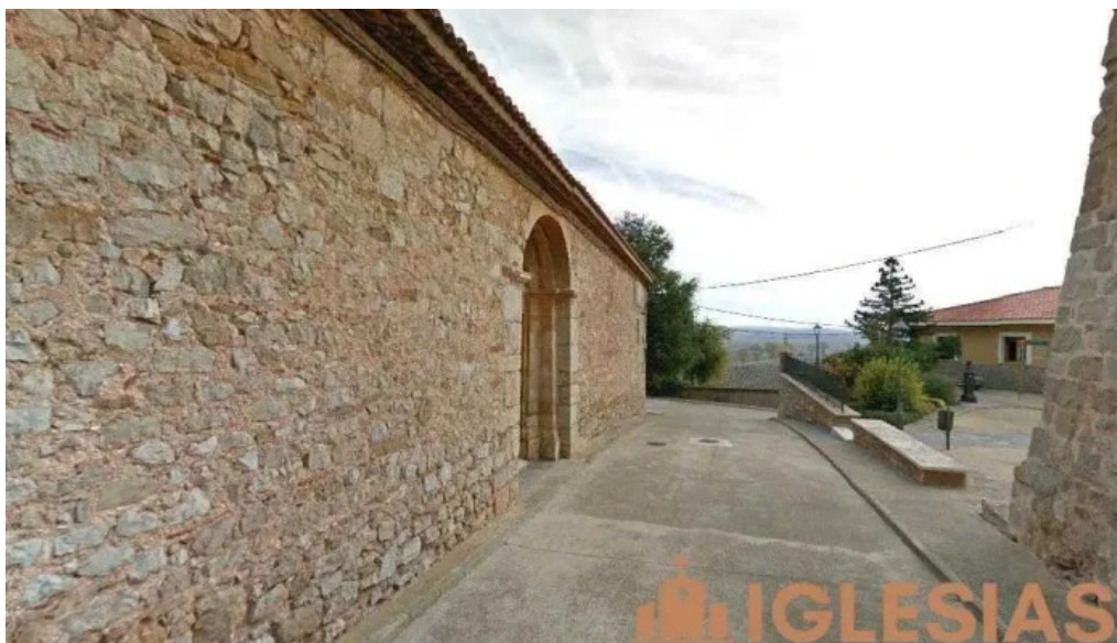
Iglesia fortificada de argente argente