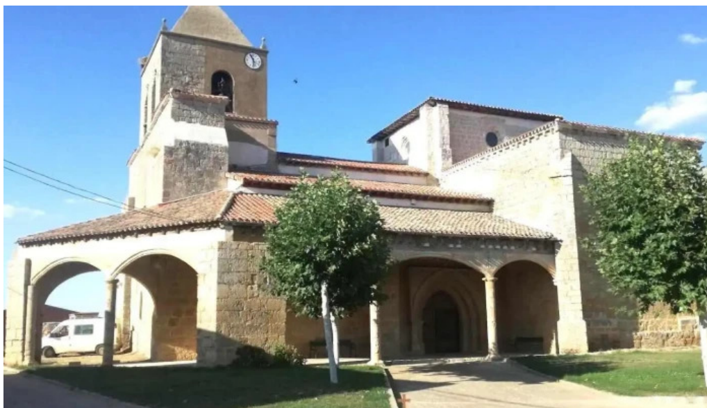
Iglesia de santa maria arenillas de riopisuerga