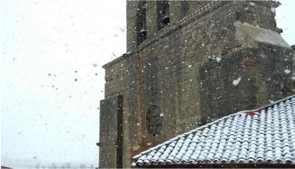
Iglesia de santa maria iglesia