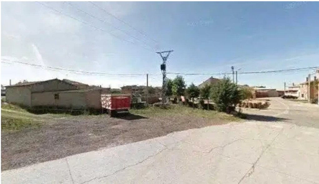
Iglesia de santa maria catalogo