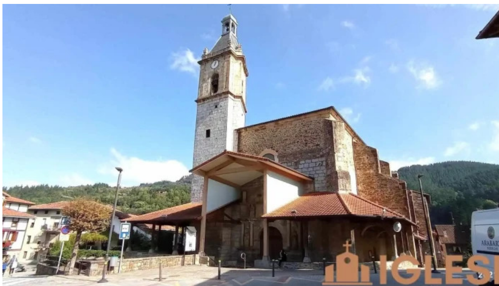
Iglesia de san bartolome areatza iglesia