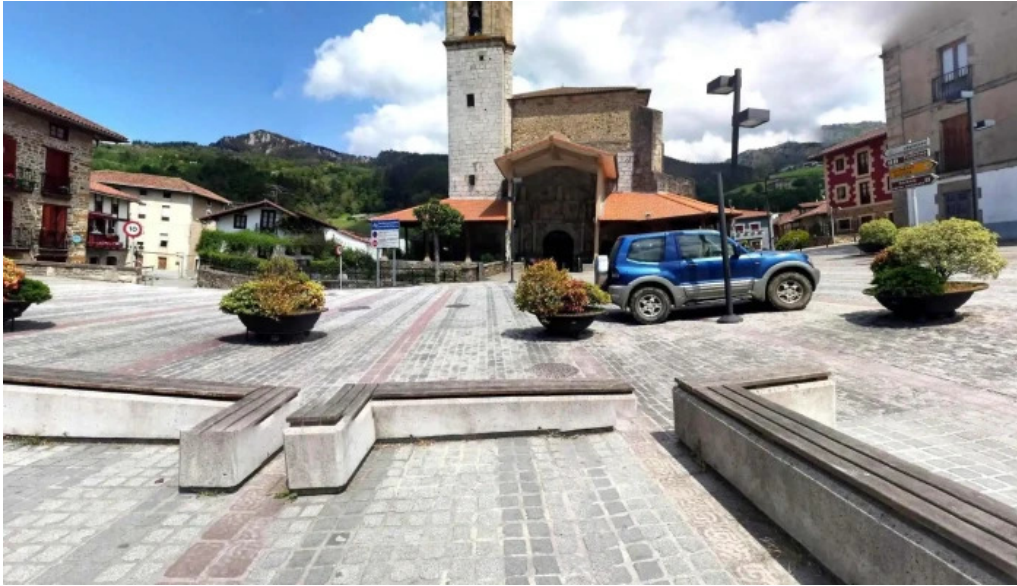
Iglesia de san bartolome areatza numero