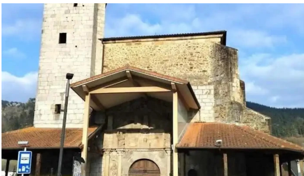
Iglesia de san bartolome areatza areatza