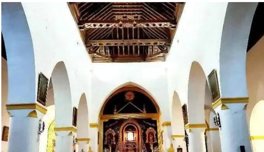
Iglesia parroquial nuestra senora de los remedios iglesia