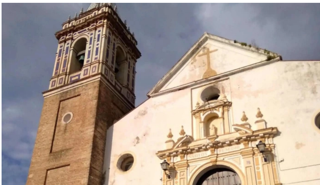
Iglesia parroquial nuestra senora de los remedios donde