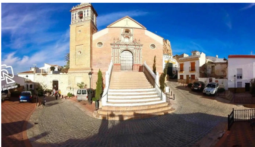
Iglesia parroquial nuestra señora de los remedios ardales