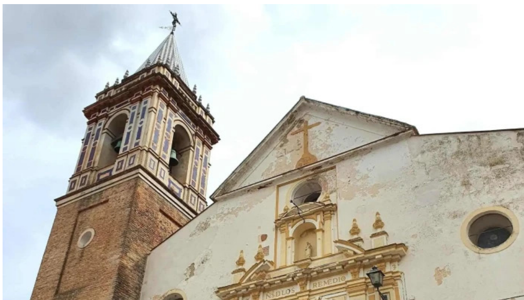
Iglesia parroquial nuestra señora de los remedios catalogo