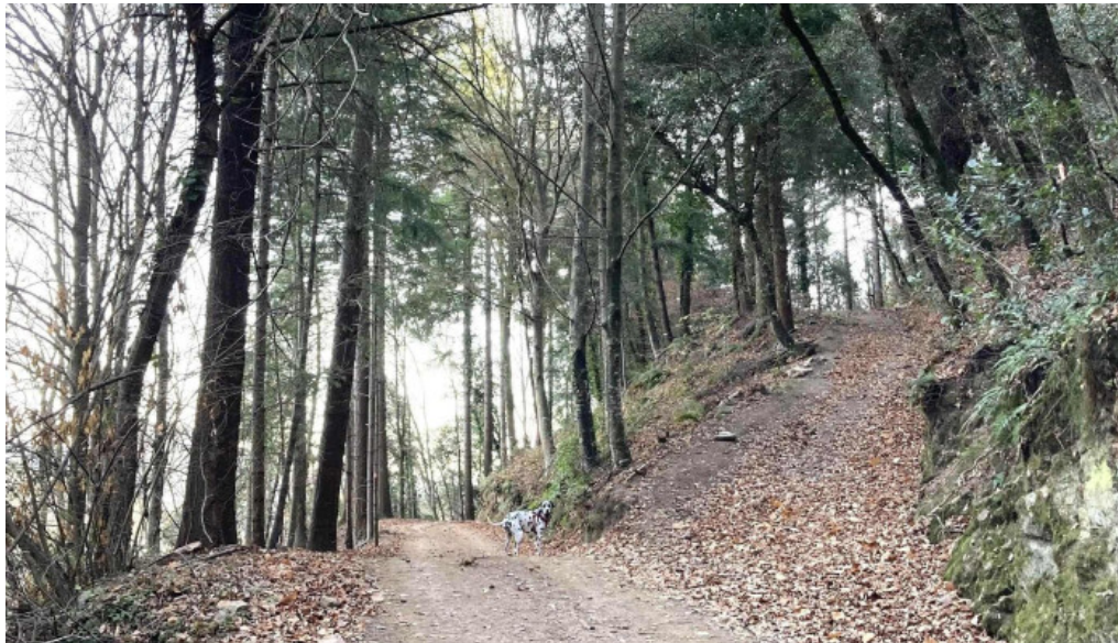
Iglesia de san cristobal de cerdans sitio web