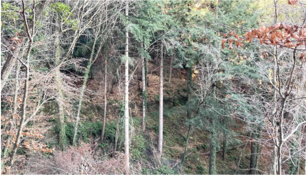
Iglesia de san cristobal de cerdans puntaje