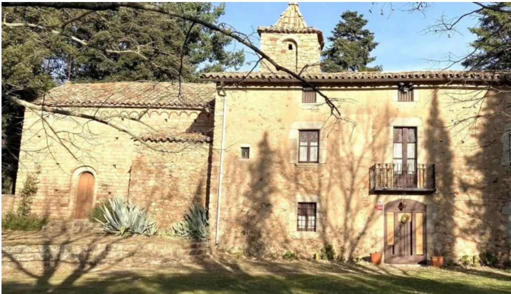
Iglesia de san cristobal de cerdans arbucies