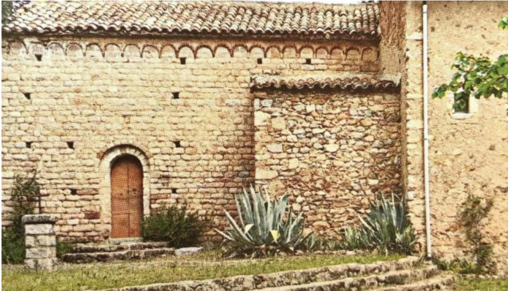
Iglesia de san cristobal de cerdans iglesia